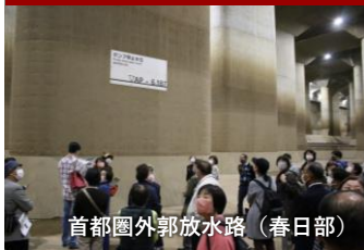
首都圏外郭放水路（春日部）

会員やそのご家族・ご友人のほか、赤十字事業を支援する方々が参加し、交流を深めています。