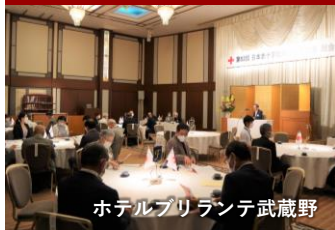
ホテルブリランテ武蔵野

決算報告や事業計画・予算審議などを行います。総会後は、各方面から講師を招いて講演会を行っています。