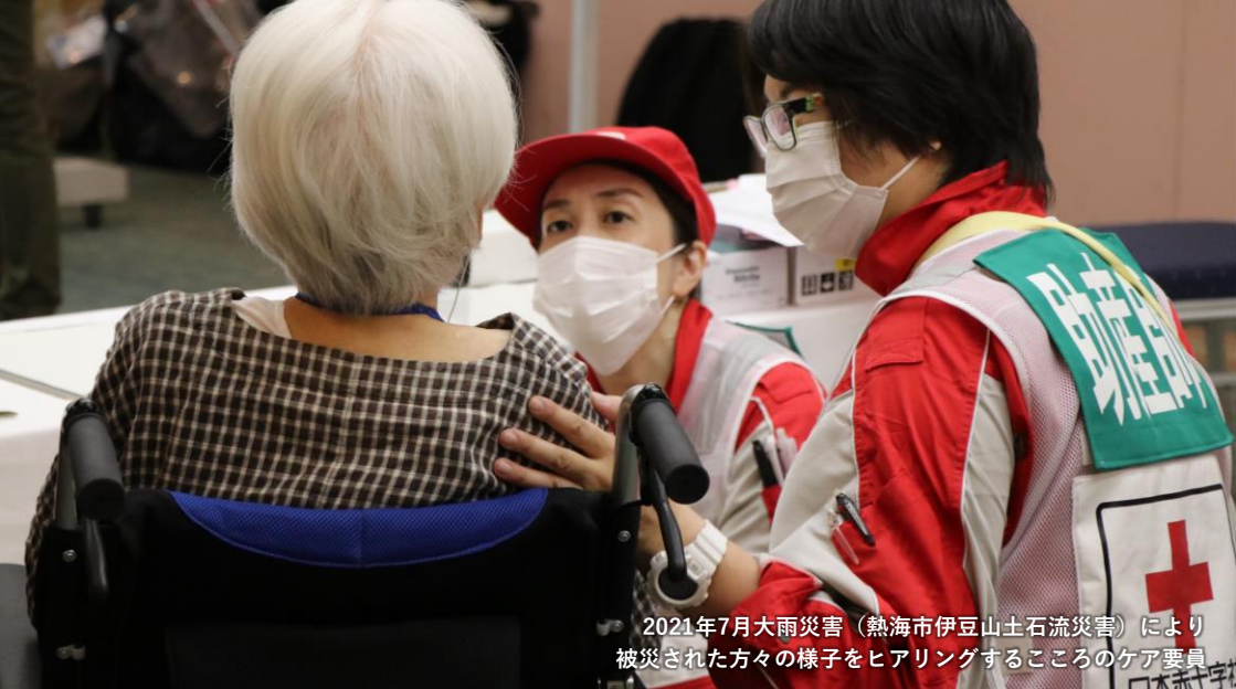
2021年7月大雨災害（熱海市伊豆山土石流災害）により被災された方々の様子をヒアリングするところのケア要員