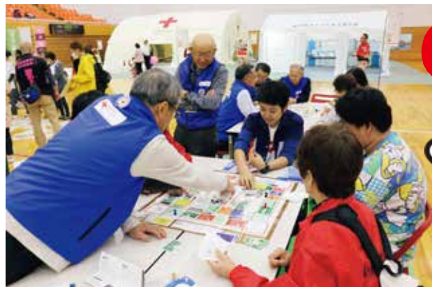
昨年度の赤十字フェスの様子