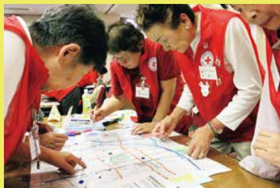
大きな地図を使って災害時の地域の危険をチェック！

地域にある赤十字奉仕団等を対象に赤十字防災セミナーを行っています。セミナーの内容は、防災や減災の考え方、地震・風水害をもたらす様々な被害から、平時の備えの重要性を理解する講義『災害への備え』。被災した人々の視点で書き留められた読み物から、災害を追体験し、被災状況をイメージするグループワーク『災害エスノグラフィー』。地域の防災マップの作成を通じ、防災上の資源や危険性を把握し、個人や地域の防災意識を高める『災害図上訓練（DIG）』です。奉仕団員のみなさんは、防災意識を高め、災害発生時の応急対応ができるよう、楽しみながら学んでいます。