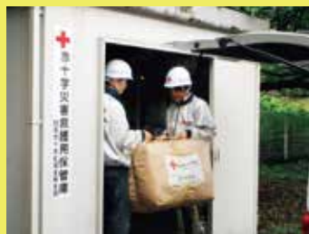
災害救援用保管庫