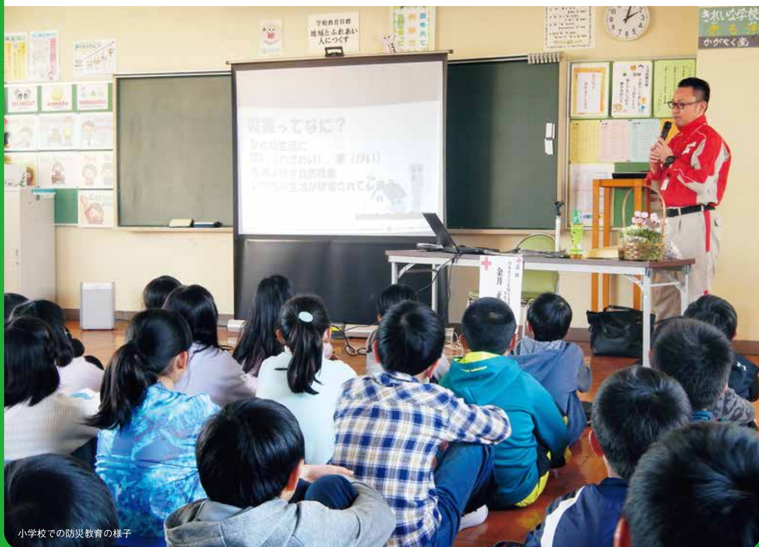
小学校での防災教育の様子