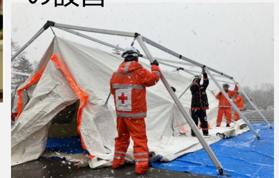
救護員宿泊用テントの設営