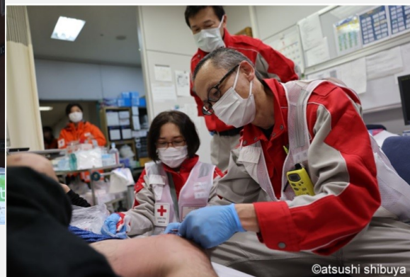
救護所での医療提供