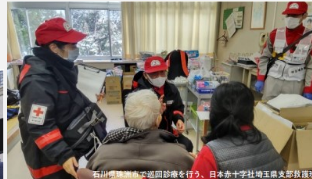
孤立地域など各避難所での巡回診療