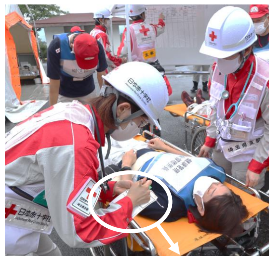
トリアージタグを用いて傷病者の優先順位を判定する訓練の様子

ご取材いただける場合は、6/25(木)正午までに別紙「取材連絡票」の送付をお願いします。