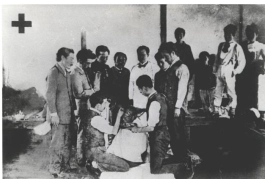
日赤初の災害救護「磐梯山噴火」(1888年)

現在は、全国490班 6,226人（令和7年3月31日現在）の救護班が、病院での業務を行いながら、研修や訓練を通じて、災害救護に必要な知識や技術を身に付け、発災時にいち早く駆け付けて救護活動ができるように体制を整えています。各支部には、救護に必要な各種車両や無線、テントや照明機器などの物的リソースの他、救護班をはじめ、こころのケア要員や原子力災害医療アドバイザーなど、多彩な人的リソースも有し、災害に備えています。