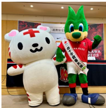
昨年の締結式での様子 同日は撮影会も実施!!