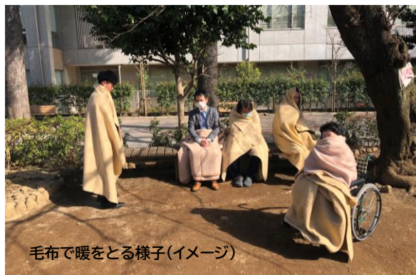
毛布で暖をとる様子(イメージ)

毛布をガウン状に羽織ると、体に密着して温かく動きやすくなります。 タオルケットでも可能です。