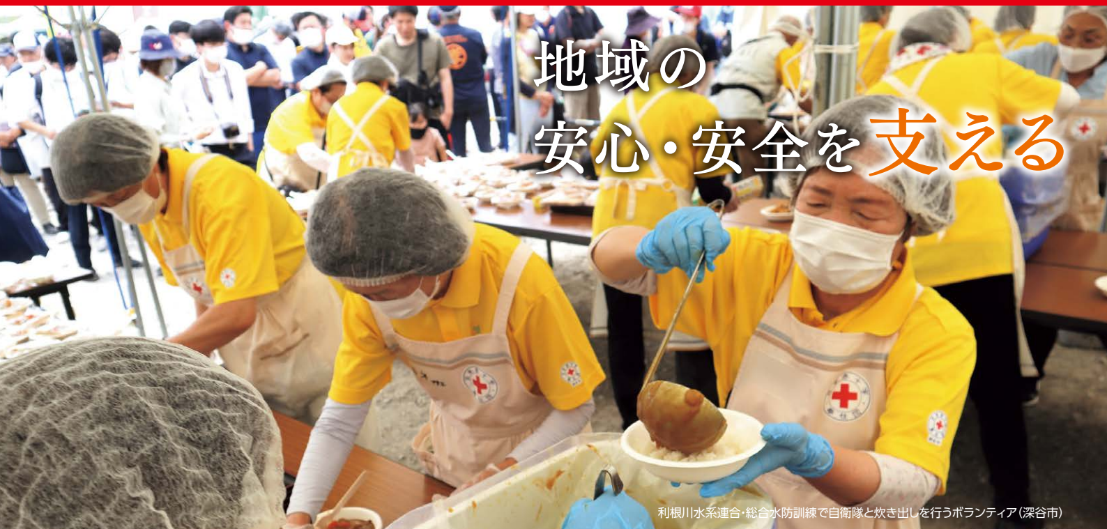
利根川水系連合・総合水防訓練で自衛隊と炊き出しを行うボランティア(深谷市)