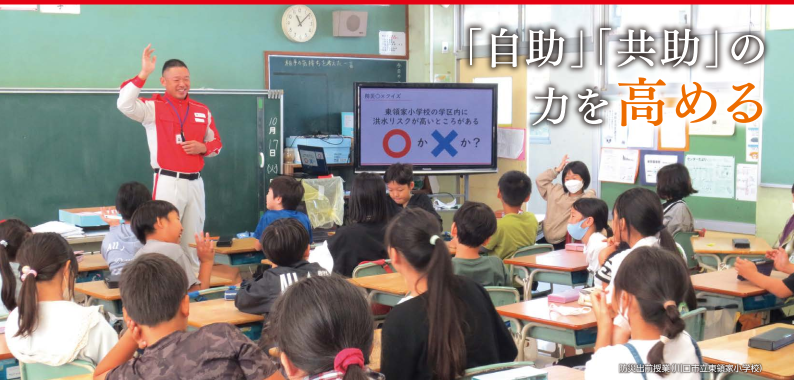
防災出前授業(川口市立東領家小学校)