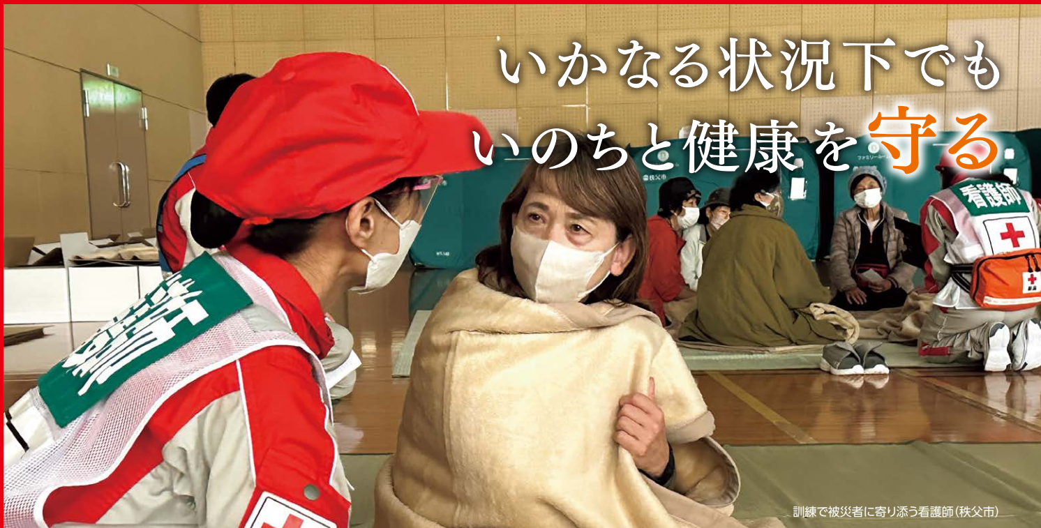
訓練で被災者に寄り添う看護師(秩父市)