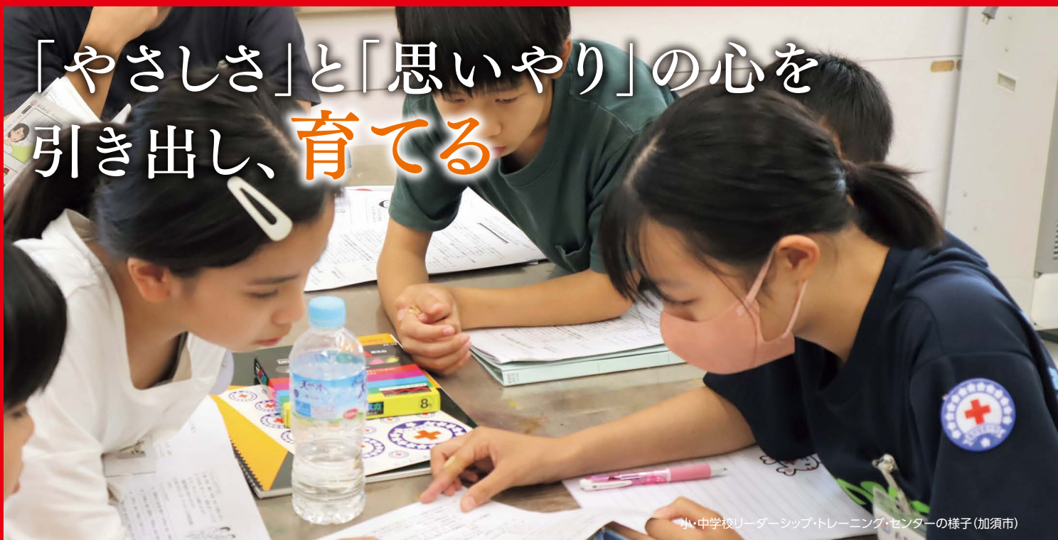
小・中学校リーダーシップ・トレーニング・センターの様子(加須市)