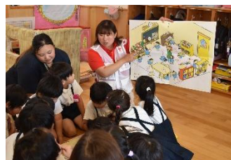
博愛の里こども園年長