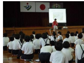
千代田中部小:垂直避難