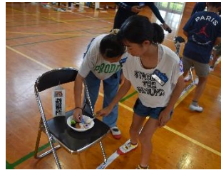
トレセン「救援物資を運べ」