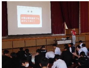
西有田中学校（水害）