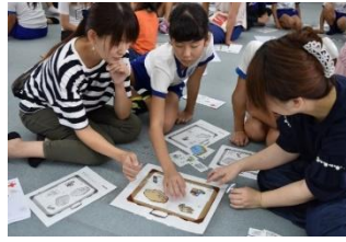
災害時シミュレーション