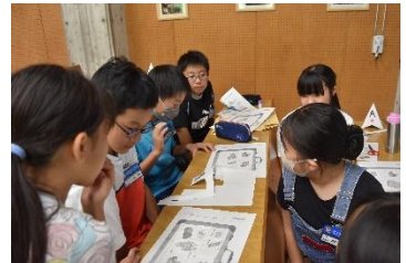
災害時シミュレーション体験