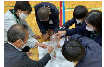
附属小学校年生親子防災