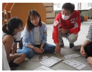
御船が丘小学校5年生