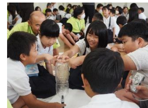
北茂安小:ドローイングチャレンジ