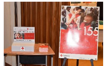
海外たすけあい募金箱