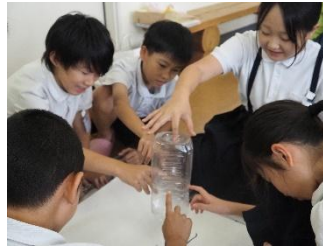
北茂安小学校：防災学習 博愛の里こども園：JRC講話