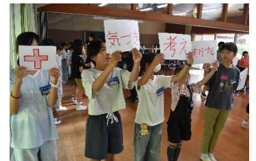
青少年赤十字 PR 動画作成