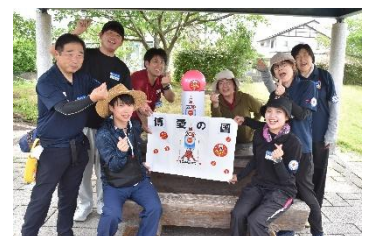
フィールド・ワーク