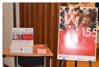
海外たすけあい募金箱