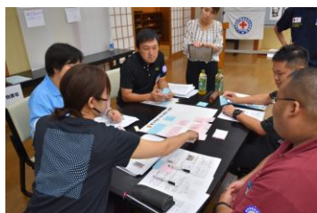
グループ・ワーク

6月20日(金)・21日(土) 1泊2日 ・「四季彩ホテル千代田館」 ・中堅教諭(中堅養護教諭)等資質向上研修(選択研修)の対象として選択も可能。 ・経費(交通費・宿泊費・食費・資料代等)は、日赤佐賀県支部が負担します。