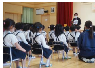
国見中学校：防災講座 博愛の里こども園：JRC講話