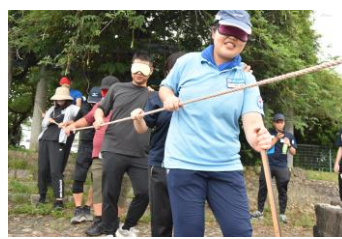
フィールド・ワーク