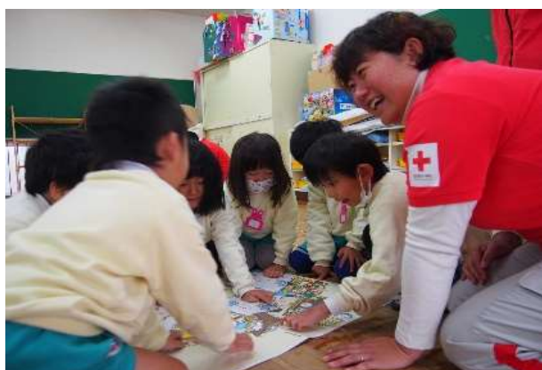
きけん はっけん教材の活用