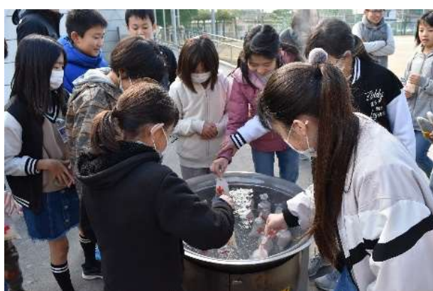
PTA 行事「災害食づくり体験」