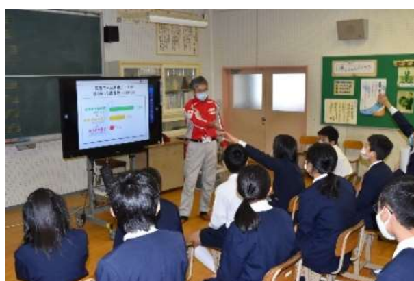
いのちの教育「防災学習」風景