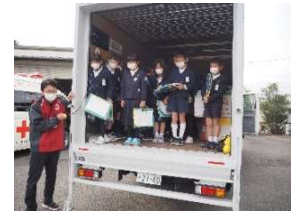
千代田中部小3年支部見学