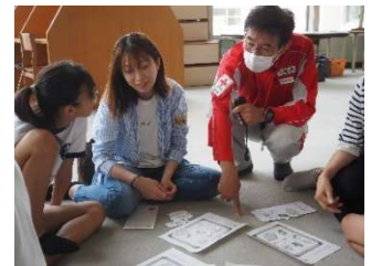
御船が丘小学校5年生