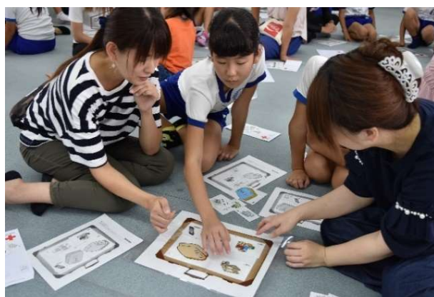
PTA 親子ふれあい活動で活用