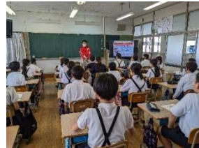
千代田中部小学校6年