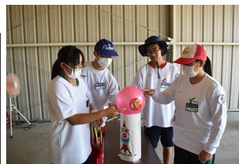
フィールド・ワーク

「小学校の部」 7月30日(火) 7月31日(水) 「中学校の部」 7月25日(木) リモート(事前) 8月1日(木)・2日(金) 「高校の部」 7月26日(金) 7月27日(土) ※場所：北山少年自然の家(小・中学校) 佐野歴史館・日赤佐賀県支部(高等学校)