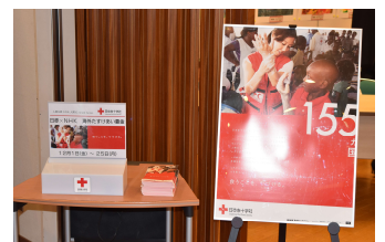
海外たすけあい募金箱