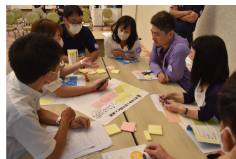
グループ・ワーク

7月5日(金)・6日(土) 1泊2日 ・「四季彩ホテル千代田館」「日赤佐賀県支部」 ・中堅教諭(中堅養護教諭)等資質向上研修(選択研修)の対象として選択も可能。 ・経費(交通費・宿泊費・食費・資料代等)は、日赤佐賀県支部が負担します。