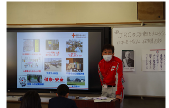
千代田中部小学校：救急法 三根東小学校：JRC講話