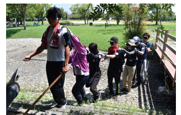
フィールド・ワーク