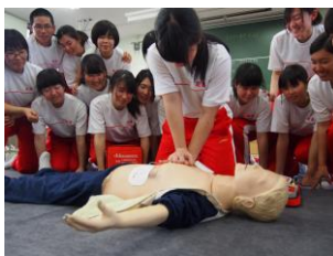
牛津高等学校：救急法

救急法、水上安全法、幼児安全法、健康生活支援講習、防災セミナー、献血講座、加盟登録式（結団式、加盟式）への講師派遣など、利用できます。加盟校は、講師代がかかりません。