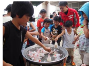
日新小学校：防災セミナー