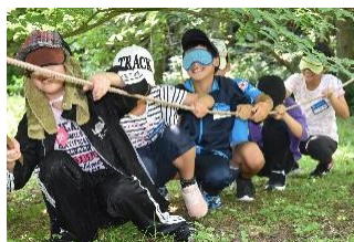
フィールド・ワーク