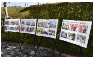
熊本地震災害パネル