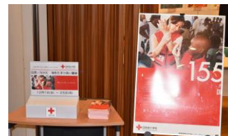
海外たすけあい募金箱