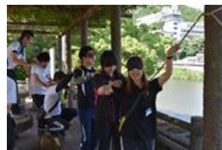
フィールド・ワーク