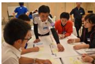
グループ・ワーク