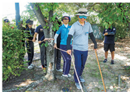
フィールドワーク「暗黒の国」で 目が不自由な方の感じ方を体験する参加者

当日は、佐賀県内の青少年赤十字指導者22名が講師・運営を担当し、参加者は、講義だけでなく、体験を通して学びを深めました。