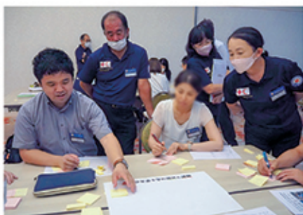
各学校の青少年赤十字活動の現状と 課題についてグループで話し合い