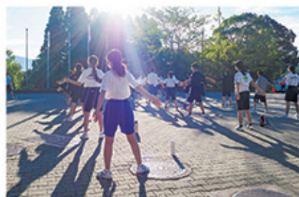
朝のつどい (中学校の部)