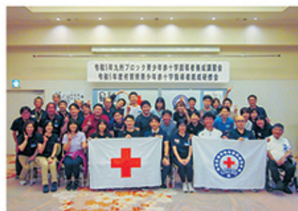
参加者とスタッフの集合写真