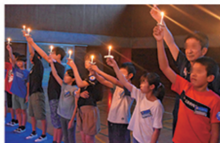
キャンドルサービスの様子 (小学校の部、7月31日～8月1日)

ご協力いただいた先生方、VS(ボランティアスタッフ)の皆さん、ありがとうございました！