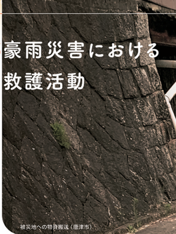
被災地への物資搬送(唐津市)