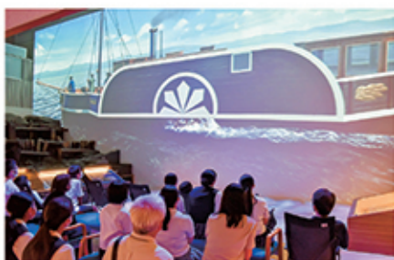
歴史館で見学 (高等学校の部、7月29日、8月6日)