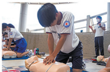
心肺蘇生の方法を学ぶ参加者 (中学校の部、8月2日～8月3日)