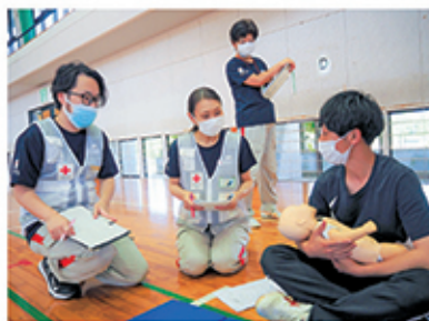
避難者役から話を聞く 看護師と主事

赤十字常備救護班要員研修会に、初めて佐賀県災害派遣福祉チーム(佐賀DCAT)に参加いただきました。佐賀DCATの活動や取り組みから、救護班員は災害時の福祉支援の重要性を学ぶことができました。また、避難所アセスメント実習では、DCATチーム員に被災者役を担っていただき、被災者の感情やニーズを丁寧に表現していただいたことで、実習がより実践的なものになり、多面的な支援の重要性を学ぶことに繋がりました。参加したDCATチーム員からは、「被災者役の経験を通じて、被災者の困難さや心の負担を深く理解できた」という声をいただきました。