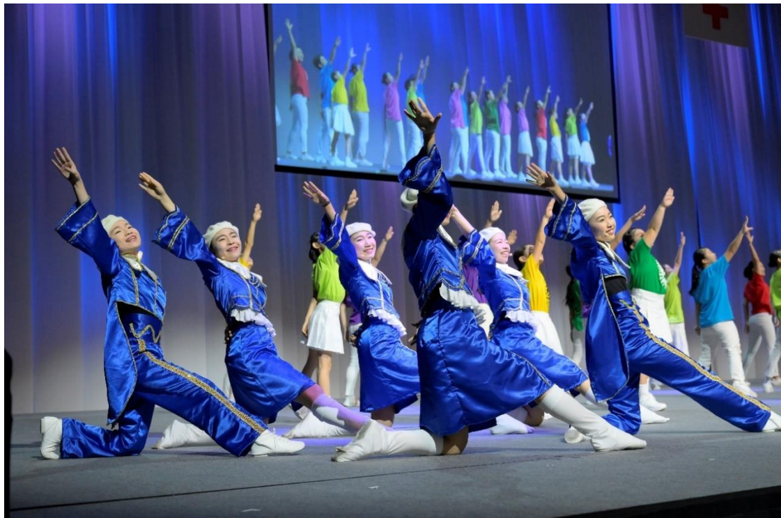
「～佐野常民生誕 200 年記念～ 令和 5 年度九州八県赤十字大会」(SAGAアリーナ)