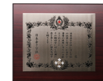
▲銀色有功章(個人・法人橋式)