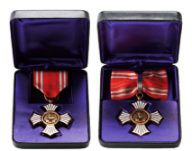
▲金色有功章個人 ※法人は橋式

※上記の表彰のほか、その金額に応じて国の表彰申請の手続きをしております。詳細は支部までお問い合わせください。