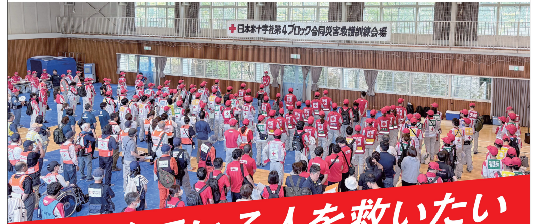
+日本赤十字社第4ブロック合同災害救護訓練会場