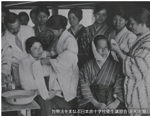
包帯法をまなぶ日本赤十字社衛生講習会(昭和初期)

日本赤十字社は、1926年から現在の「救急法」の前身である「衛生講習会」を事業に取り入れ、衛生学、救急法、家庭での看護の方法などの普及を開始しました。