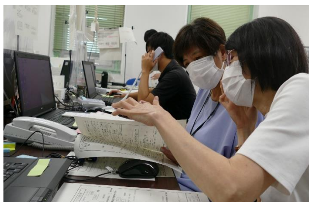
図4. 患者情報を確認する看護師