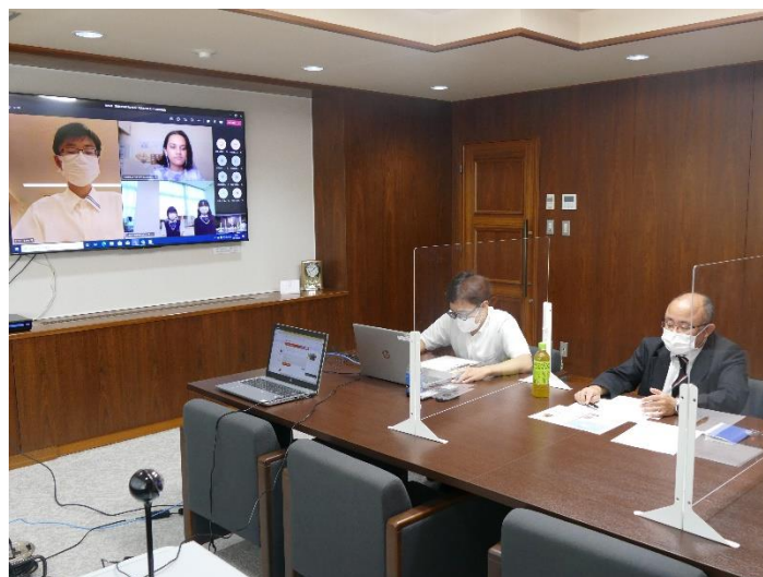
図 26. 青少年赤十字活動に関するオンライン会議の様子

大阪日赤有功会からのご支援によりオンライン環境に対応した機材等を充実することができました。