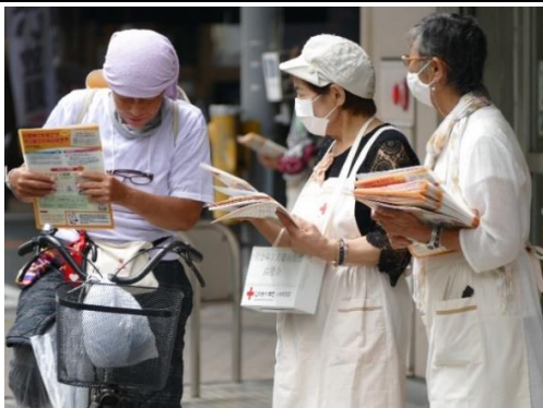
図 24. パンフレットを配布する地域奉仕団