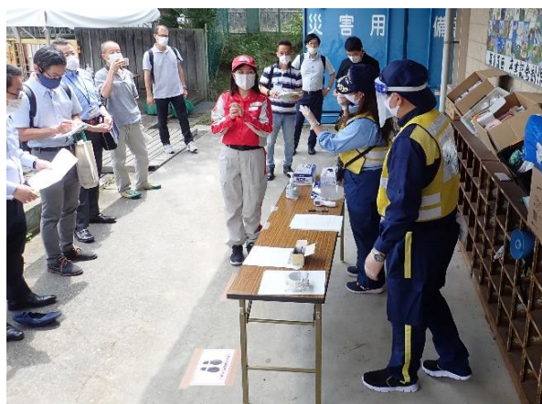
図9. 避難所受付での手指消毒を実演する職員