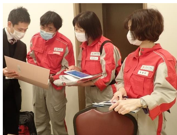
図 6. 感染拡大を防止するための受診体制を確認する救護員