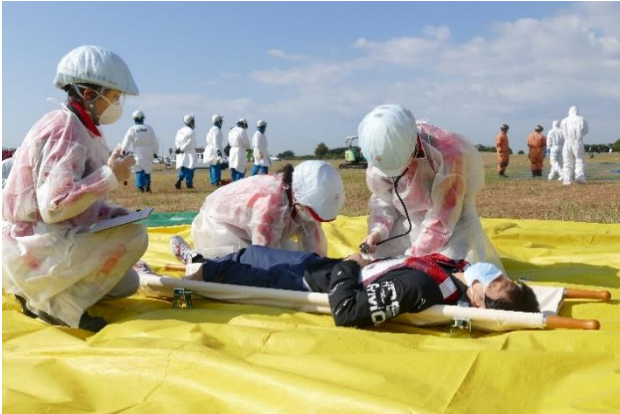
図 11. 新型コロナウイルス感染症の患者を処置するという想定での訓練

令和3年11月5日、堺泉北港堺2区基幹的広域防災拠点「近畿圏臨海防災センター」において、南海トラフ地震を想定した訓練が実施されました。大阪赤十字病院から救護班1班と院内感染対策チームの救護員が参加し、被災地救護所に搬送された新型コロナウイルス感染症の患者を処置するという想定で訓練を行いました。併せて、当支部諸君も救援物資搬送の訓練を行いました。