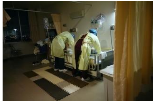
図 32. 夜中に陽性患者の看護を行う看護師