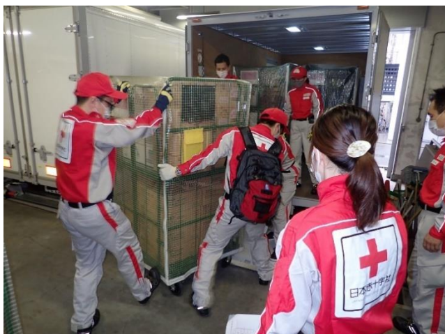
図 15. 資機材を搬出している様子

令和3年9月17日、大阪赤十字会館において、当支部職員を対象とした資機材習熟研修会を開催し、災害救護資機材の搬入・搬出、事務作業の展開、既存の通信インフラが破壊された状況下での「通信環境の構築」、「無線機」を使用した実習、「トラックや緊急車両」の運転等を行いました。