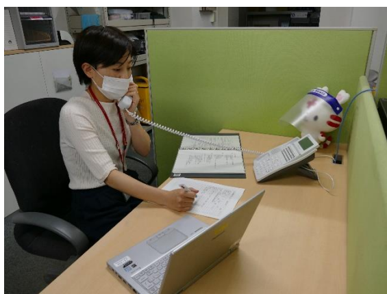
図 22. 窓口で相談による職員（看護師）