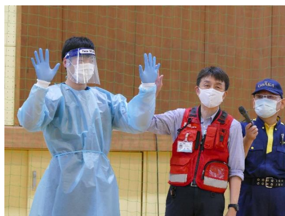
図10. 防護服の着脱方法を指導する職員