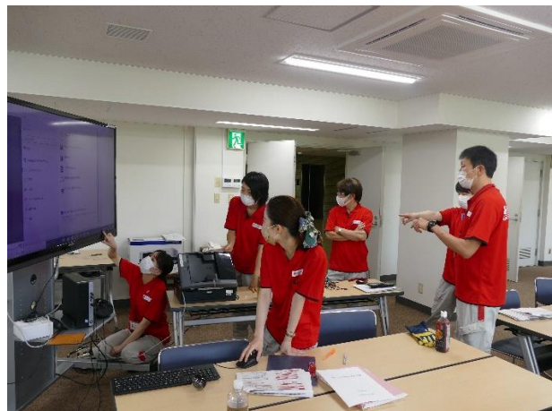
図 14. 情報通信機器の使用方法を確認する様子