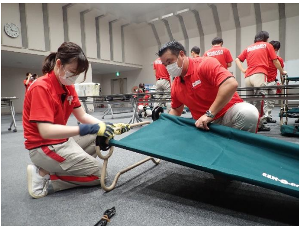
図 13. 簡易ベッドの設営方法を確認する様子

令和3年8月25日、大阪赤十字会館において、当支部職員を対象とした災害対策本部要員研修会を開催し、「災害対策本部要員の災害対応」演習、平时に会議室として使用しているスペースの「ロジスティクス中継基地及び災害対策本部」設置実習、衛星通信や大型情報モニターを用いた「通信資機材や情報端末の設定」実習、災害時の様々な情報を収集・集約する「クロノロジー実習」等を行いました。