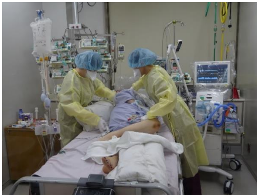
図 29. 陽性重症患者の管理を行う看護師