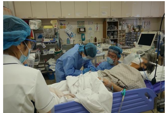
図 30. 感染防止を徹底して治療にあたる医師