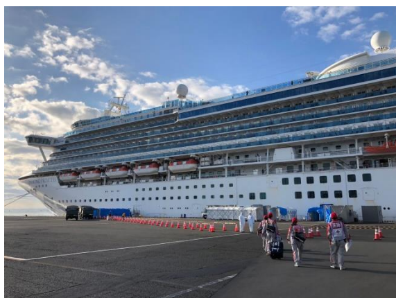
図1. クルーズ船に向かう救護班