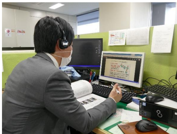
図 17. オンライン研修を受講する支部職員

コロナ禍での災害救護活動を安全かつ適切に行うため、「感染症に対する知識」や「災害救護活動時の感染対策」などについて、大阪赤十字病院や日本赤十字社和歌山医療センターの医師から映像配信型で講義を受け、救護員の感染対策にかかる知識向上を図りました。