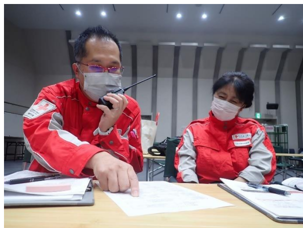
図 16. 無線の実習の様子