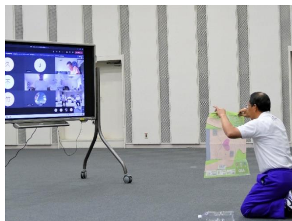
図 27. オンライン講習で心肺蘇生やAEDの使い方を指導する救急法指導員