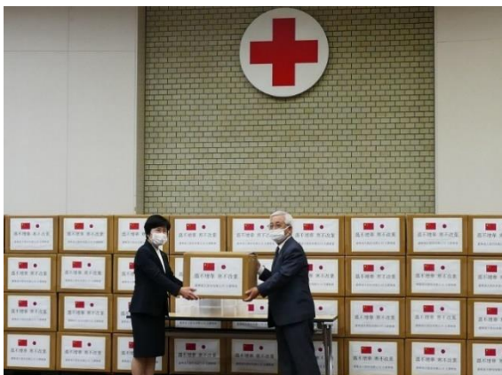
図 18. マスクを大阪府支部において受贈

令和2年4月10日に大阪府日中友好協会の紹介により、中国企業からマスク15万枚の寄贈を受けました。地域の保健医療活動・地域福祉活動を推進されている地区・分区に対し、提供しました。