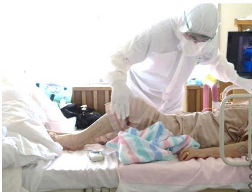
図 31. 陽性患者にリハビリを実施する理学療法士