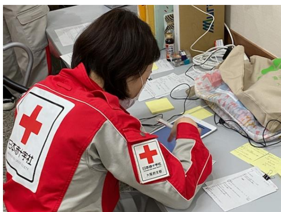
図 5. 患者情報を確認する看護師