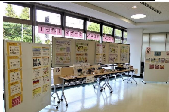
図 25. 感染拡大防止を訴える展示ブース