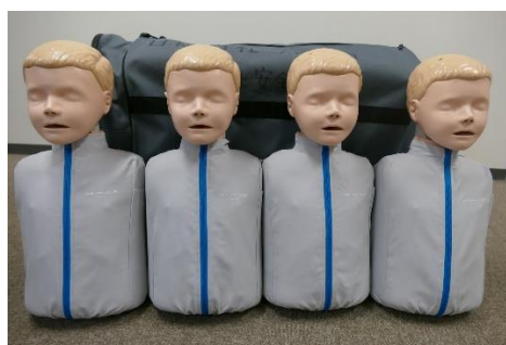
図 28. 寄贈いただいた蘇生人形