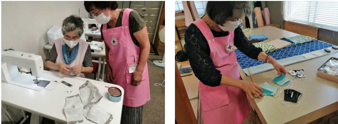
図 23. 色とりどりの生地を使ってマスクを作製する裁縫ボランティア

大阪市西成区愛隣地区の訪問看護ステーションが立ち上げた「あいらん手作りマスクプロジェクト」に10人以上の裁縫ボランティアが参加し、マスクの作成に協力しています。マスクの布地やゴム紐等は、大阪日赤有功会から寄付をいただいています。