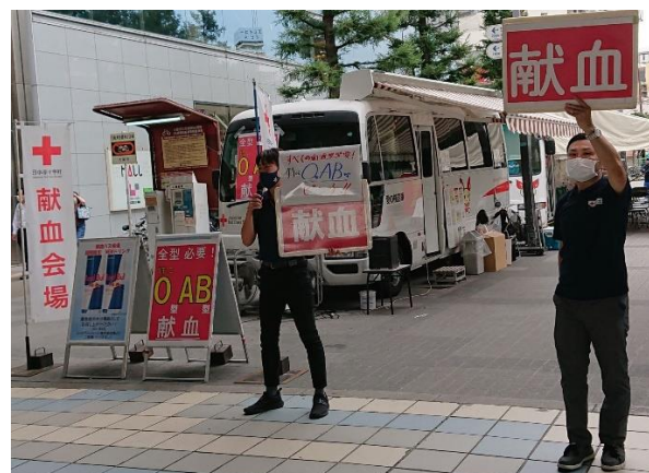
図 33. コロナ禍で血液不足が心配される中、献血の呼びかけに協力する支部職員(両写真とも右端)