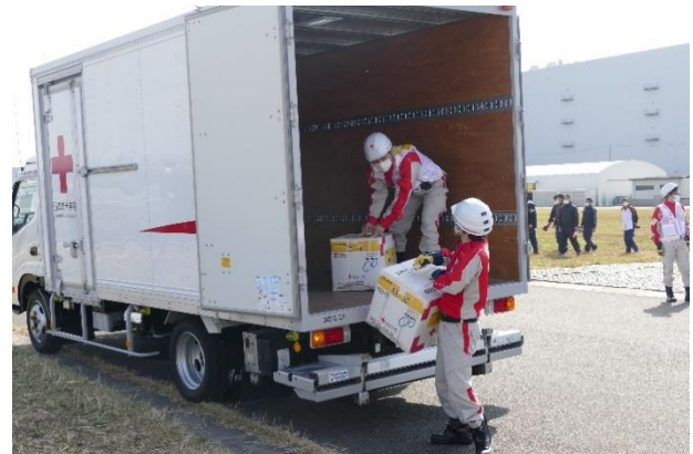
図 12. 救援物資の搬送を行う訓練