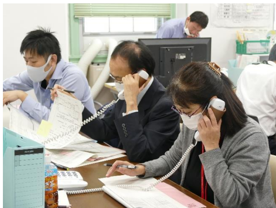
図3. 受入病院と連絡を取り合う看護師