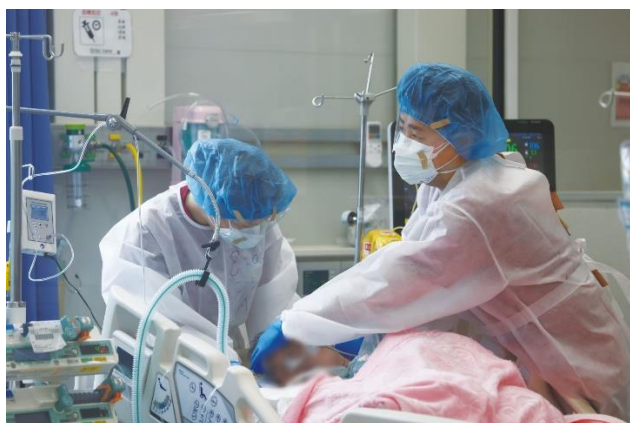
図7. 意識のない重症患者のケアを行う看護師