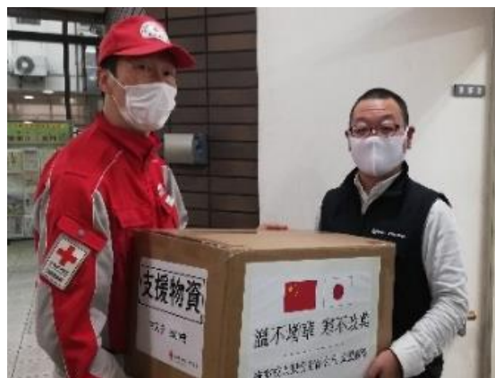
図 19. 寄贈されたマスクを支援物資として配分