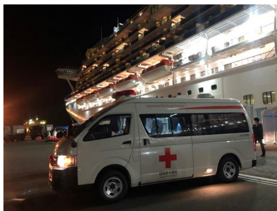
図2. 24時間オンコール体制で対応する様子