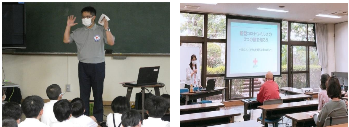
図 21. 地域の学校や公民館などで「新型コロナウイルスの3つの顔を知ろう！」を説明する職員