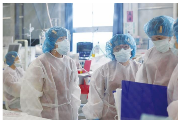
図8. 大阪コロナ重症センターで活動する看護師