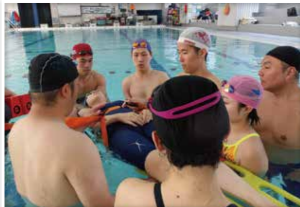
水の事故防止や救助方法等を学ぶ水上安全法講習