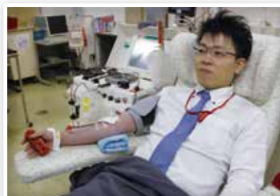
献血ルームで献血に協力する男性

大阪府赤十字血液センターでは、献血ルームと移動採血車で医療需要に応じた血液を確保するために、当支部から献血運搬車の整備に対して助成を行いました。