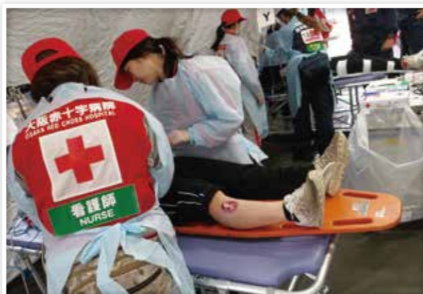
災害救護訓練に参加し、患者の処置を行う救護班 (大阪市総合防災訓練)