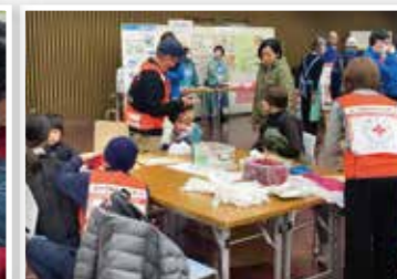
地域で防災啓発活動を行う赤十字防災デー