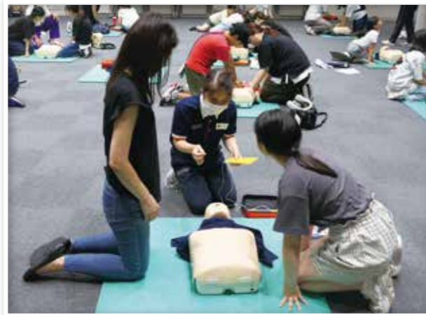
心肺蘇生やAEDの使い方を学ぶ救急法講習

事故を防止し、いのちと健康を守るための知識や技術、また地域における防災・減災に役立つ知識や技術をみなさまにお伝えするため、次の講習を府内各地で開催しました。