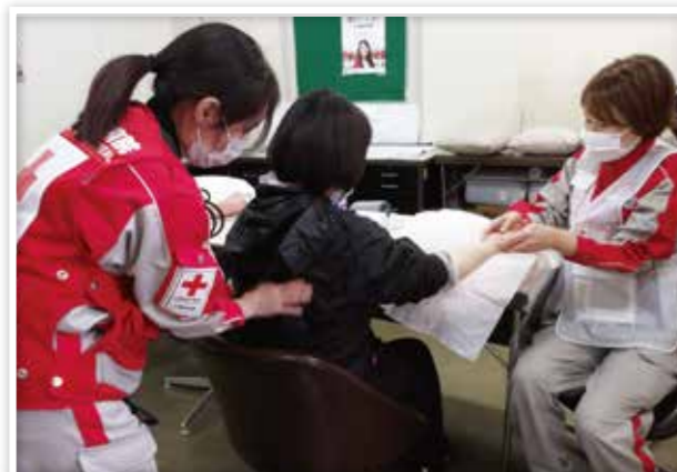
ストレスケアのハンドマッサージを行う看護師 (令和6年能登半島地震)