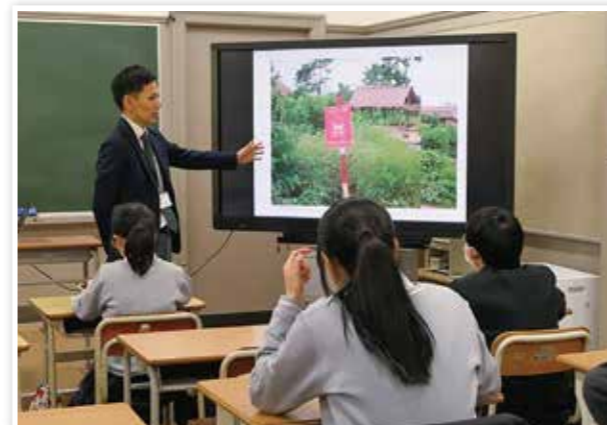
国際理解・平和学習の出前講座を行う日赤職員