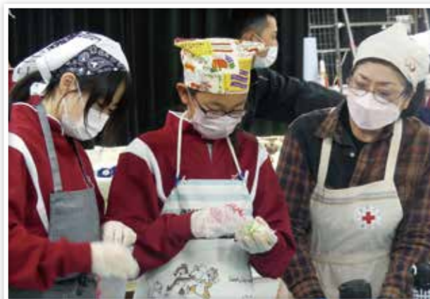
炊飯袋を活用した調理方法を伝える奉仕団員（守口市）

ボランティア育成にかかる研修や会議、ボランティア活動における運営助成などに寄付を活用しています。