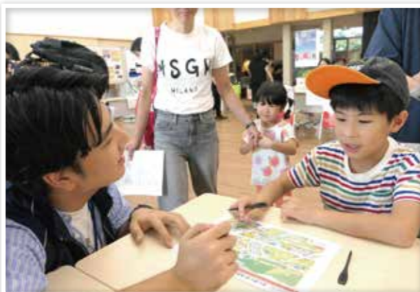
天王寺動物園とのコラボイベントに協力する青年奉仕団