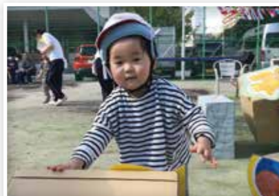
運動会で競技に参加することたち

大阪赤十字病院附属大手前整肢学園では、医療型障がい児施設として、利用者の生活向上のための支援を行いました。