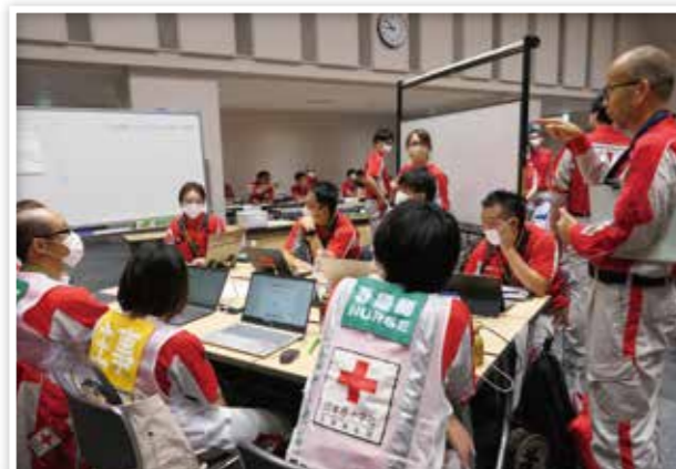
救護の知識と技術を学ぶ救護員(ブロック救護班研修)