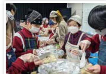
炊き出しの方法を伝える奉仕団員