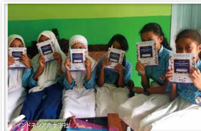
学校で防災を学ぶ生徒たち (インドネシア防災強化事業)