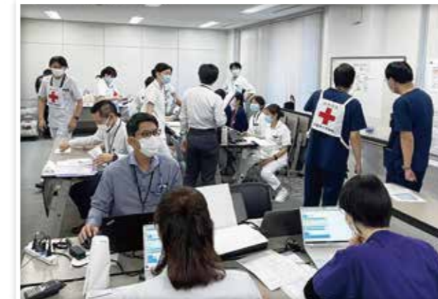
近畿地方DMATブロック訓練に参加する 大阪赤十字病院職員