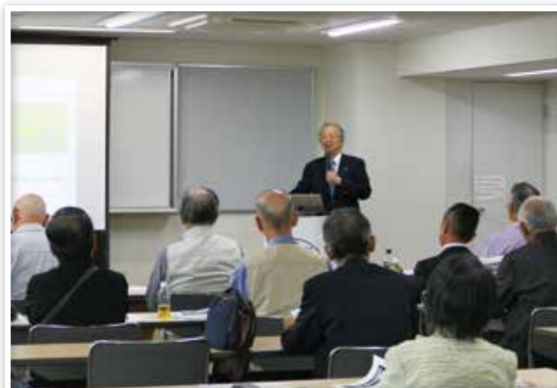
防災に関する講演に耳を傾ける奉仕団員（ボランティア研修）

赤十字の活動は、ボランティア（奉仕団員）のみなさまに支えられており、今日も各地で活躍しています。