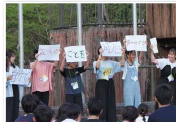
リーダーシップ・トレーニング・センターで目標を共有するメンバー