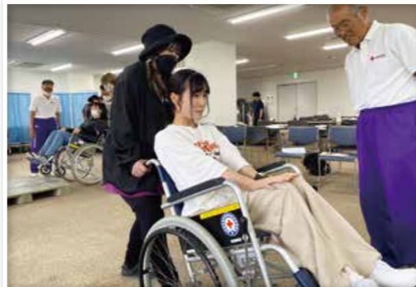
健康寿命の伸ばし方や自立を目指した支援を学ぶ 健康生活支援講習