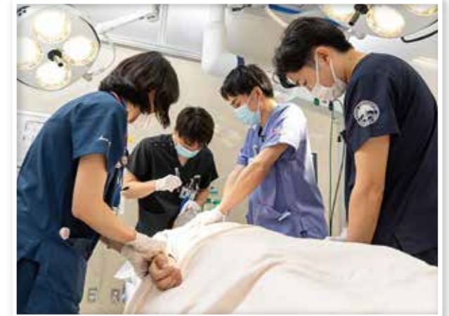
医療処置を行う医師(大阪赤十字病院)