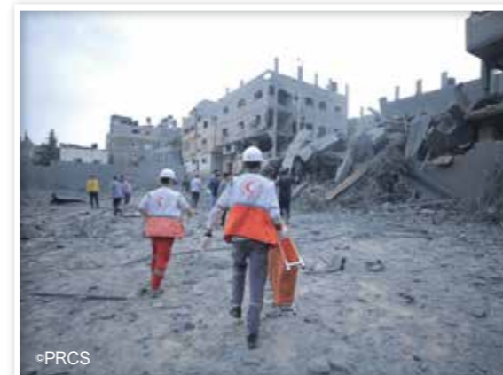
負傷者のもとに駆けつけるパレスチナ赤新月社ボランティア (イスラエル・ガザ人道危機救援金)