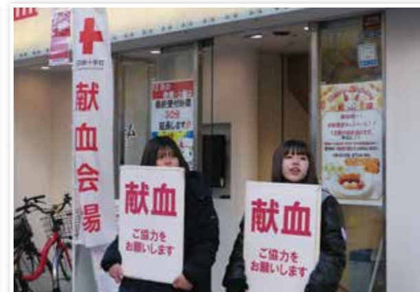
献血の呼びかけを行う高校生メンバー