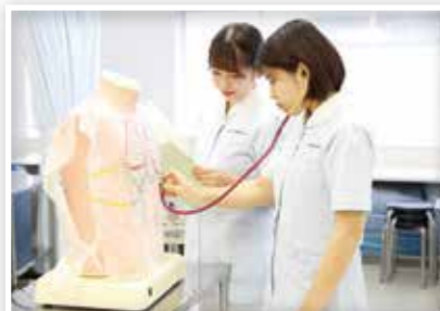
実習に臨む看護学生

優秀な赤十字看護大学生の修学支援を目的とする奨学金制度により5名の学生に対して、当支部から奨学金を貸与し、将来病院において指導的な役割を担う看護師の養成に努めました。 また、病院の奨学金貸与制度に対して助成を行いました。