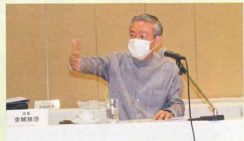
挨拶する金城会長