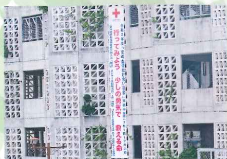
日赤安謝福祉複合施設