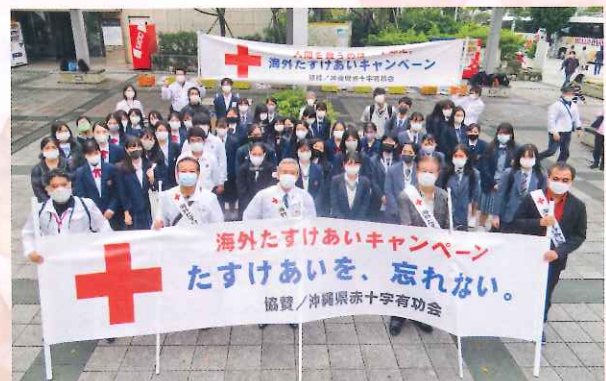
「たすけあいを、忘れない。」

12月19日 県庁前広場において街頭募金を実施され、有功会役員及び会員、青少年赤十字メンバー、赤十字職員や赤十字関係者が参加し多くの人に募金への協力を呼びかけました。