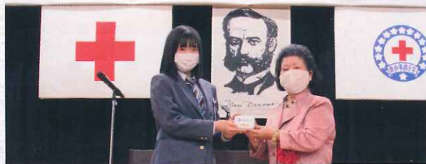
大会会場の様子(写真左)、県赤十字有功会からの記念品贈呈(写真右)