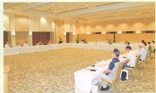
有功会役員会 会場