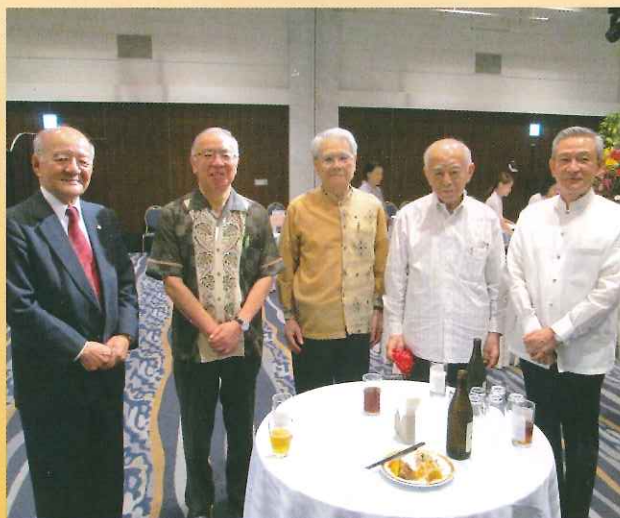
令和元年度 沖縄県有功会総会・昼食懇談会