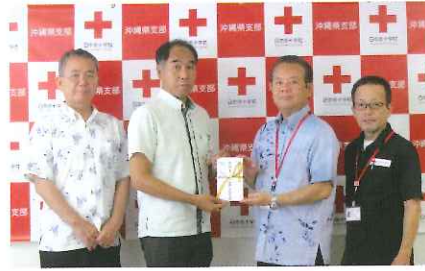
6月26日、沖縄ビル管理 株式会社 (有功会法人会員) から毎年継続していただいている活動資金の贈呈がありました。 (新垣社長・金城部長)