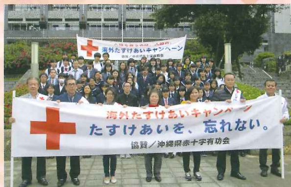
「たすけあいを、忘れない。」

12月21日(土) 県庁前広場において街頭募金を実施され有功会役員及び会員、青少年赤十字メンバー、赤十字職員や赤十字関係者が参加し多くの人に募金への協力を呼びかけました。