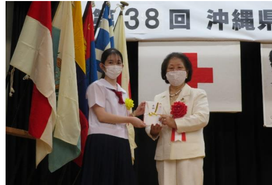
県赤十字有功会からの記念品贈呈

大会では青少年赤十字活動に取り組んでいる個人及び、学校の表彰が行われ、今年度は、個人9名、指導者1名、学校6校が受賞いたしました。