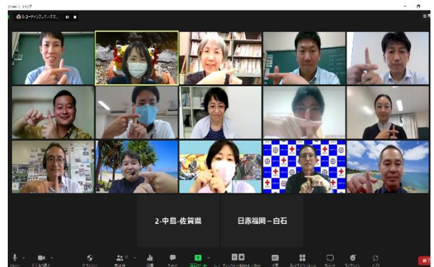
講習会の最後に記念撮影

当日は、講師を担当する県内の青少年赤十字指導者、九州各県からの受講者、支部職員ら計