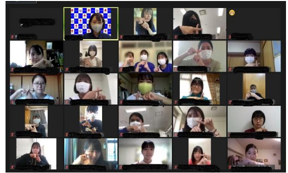
交流するメンバーの様子

青少年赤十字高校協議会のメンバーらは代替案として、他校との交流を目的としたこの企画を立ち上げました。