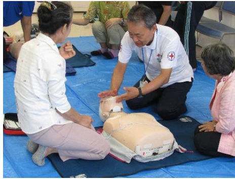
救急法などの講習