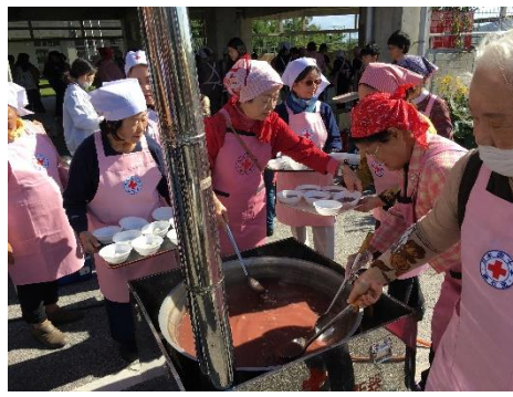
赤十字ボランティア