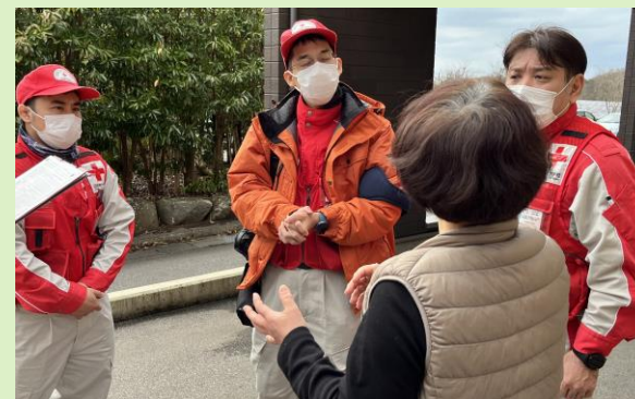
アセスメントを行う救護班

避難所や施設のインフラ(電気、水道)、生活環境(トイレ、調理場、就寝スペース)、感染症対策などについて、管理者への聞き取りや実際に避難所内を巡回して確認、評価を行った。