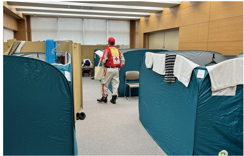
「避難所内を巡回する救護班」