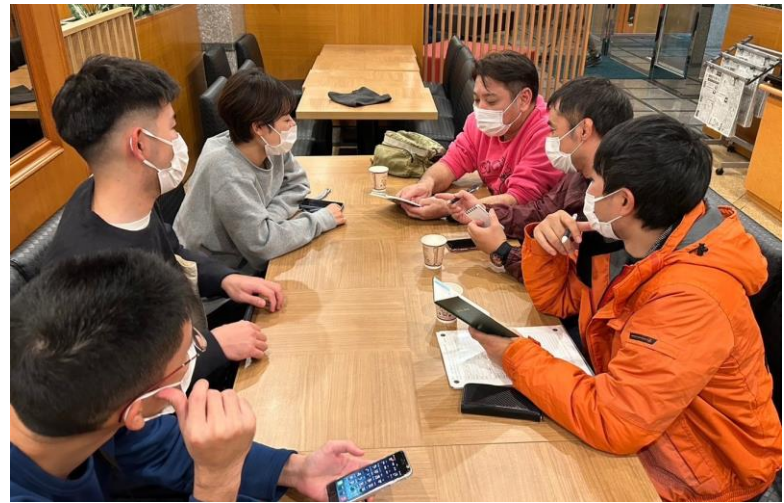
「活動に向けてミーティングを実施」