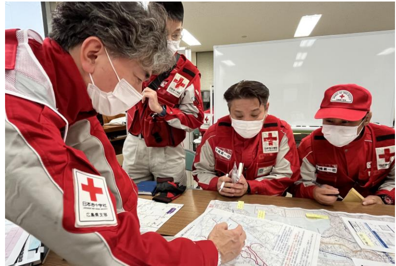
「救護活動についての説明を受ける救護班」