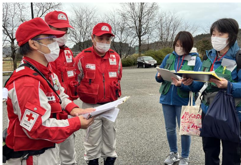
「保健師チームとのミーティング」