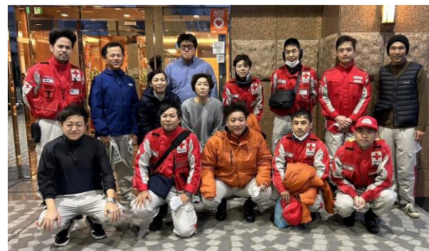
大分県赤十字救護班との集合写真