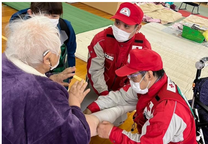
「避難者で巡回診療を行う救護班」