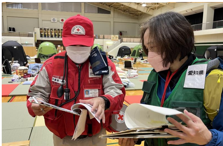
「他県から支援に来た保健師チームとの情報共有」