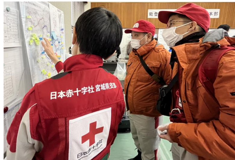
「活動場所についての説明を受ける救護班」