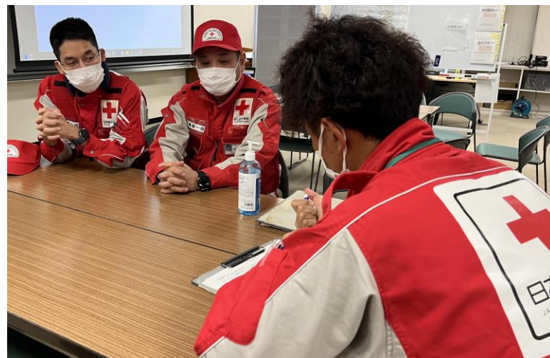
「石川県支部へ活動終了報告」