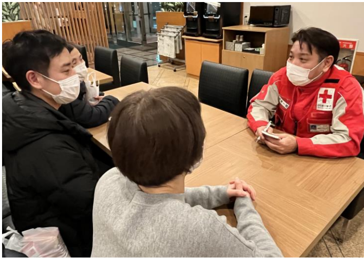
「前任の大分県赤十字救護班からの引継ぎ」