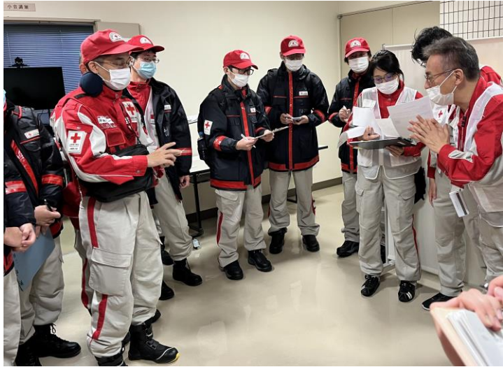
「日赤災害医療コーディネーターから活動の指示を受ける救護班」