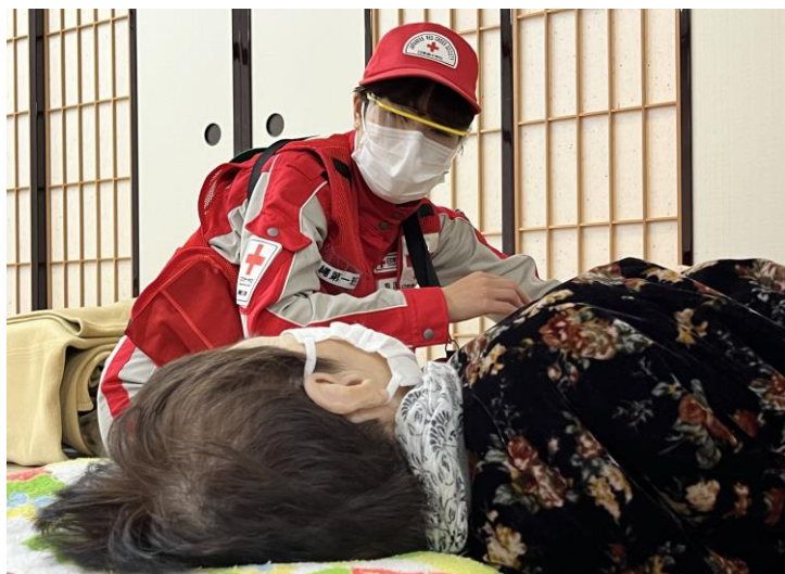
「避難所で巡回診療を行う救護班」