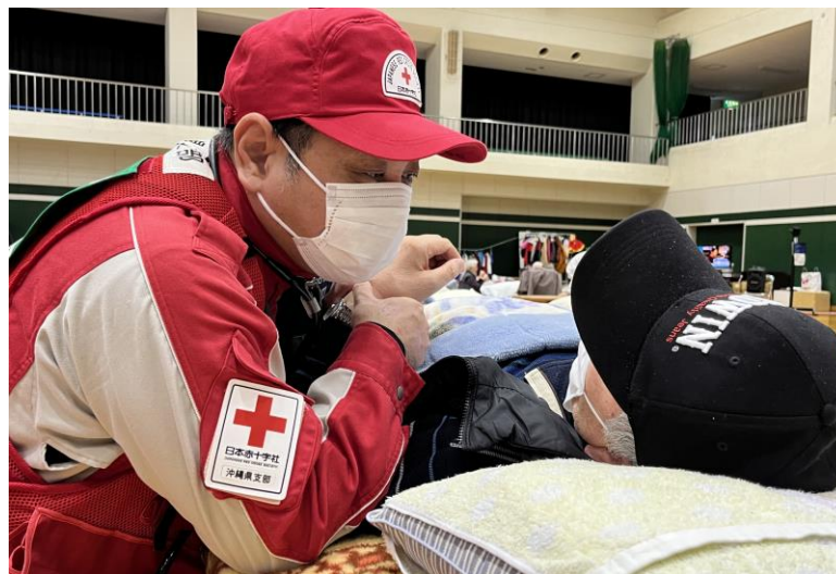
「避難所で巡回診療を行う救護班」