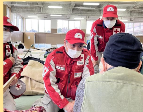
巡回診療を行う救護班

また、避難所生活で発生しやすい肺血栓塞栓症(DVT)についても、弾力包帯を用いた対応や助言などを実施した。