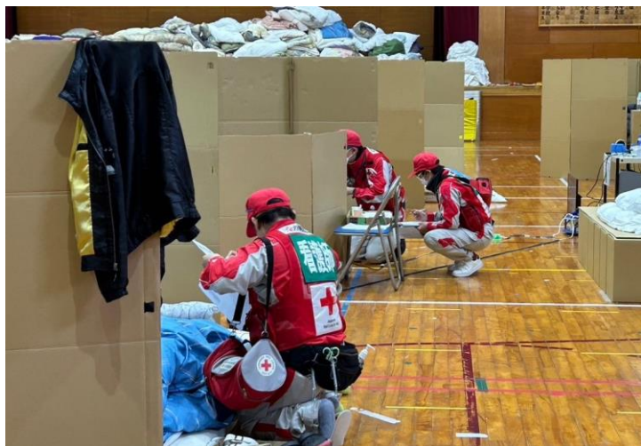
「避難者で巡回診療を行う救護班」