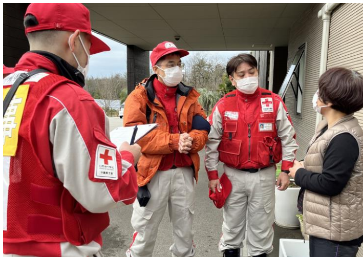
「アセスメントを実施する救護班」