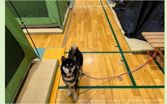
居住スペース内にペットのいる避難所