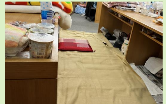
土足の床に布団を敷いている避難所