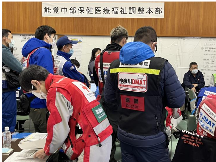
「他団体が協同する調整本部」