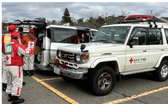
熊本県赤十字の車両を借用して活動

また、前任の大分県赤十字救護班からは、活動前に活動内容や注意点などの情報を提供いただいた。