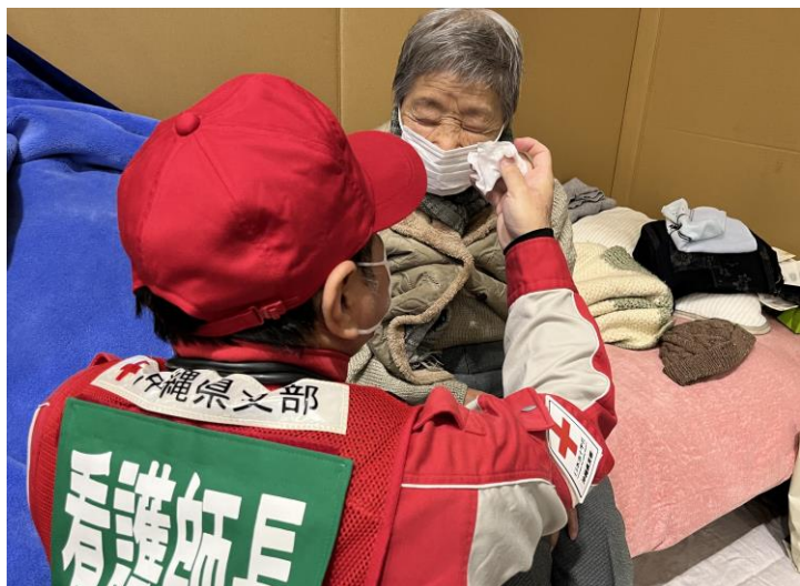
「避難所で巡回診療を行う救護班」