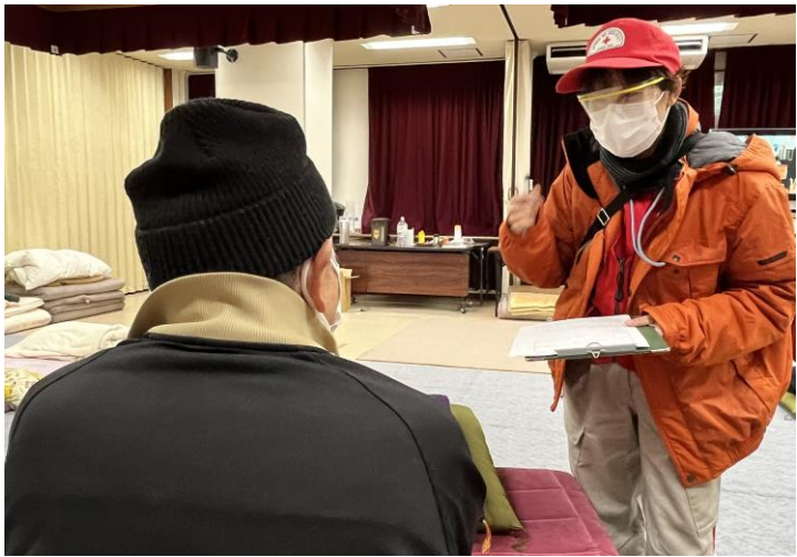
「避難者への巡回診療」