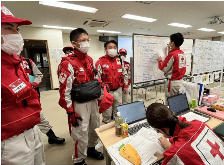
「石川県支部へ到着報告を行う救護班」