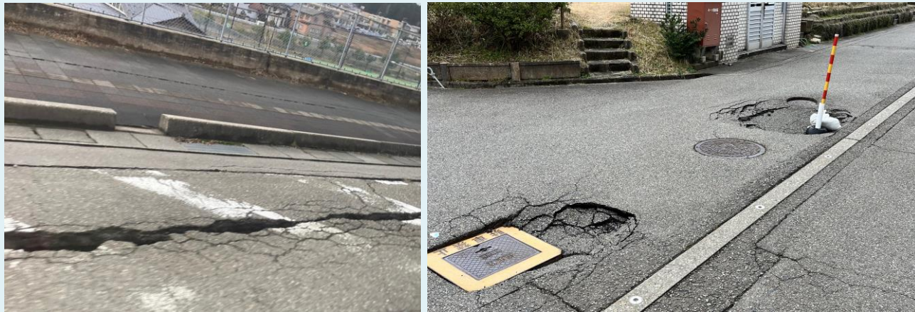
破損、陥没した道路