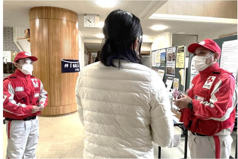
「避難所の運営スタッフへの聞き取り」