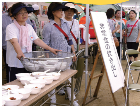
▲ 地域イベントでの非常食炊き出し