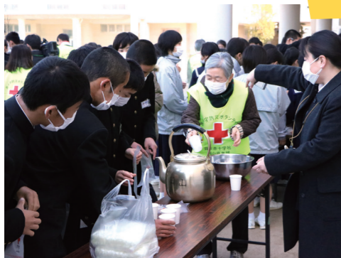
▲ 中学校での防災教室