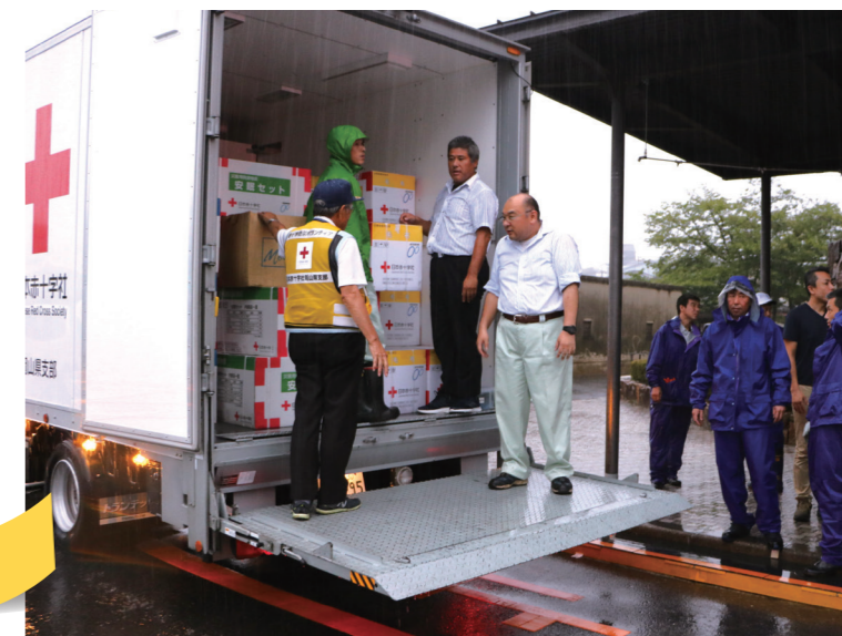
▲ 平成30年7月豪雨災害での救援物資の輸送