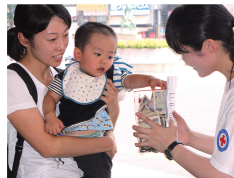
▲ 街頭での募金活動