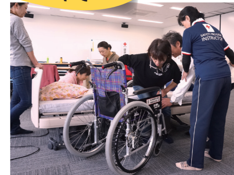
▲ 健康生活支援講習の指導