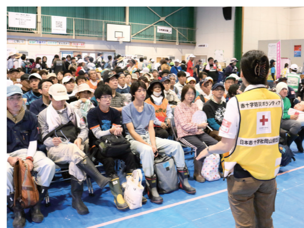
▲ ボランティアセンターでの熱中症予防のオリエンテーション