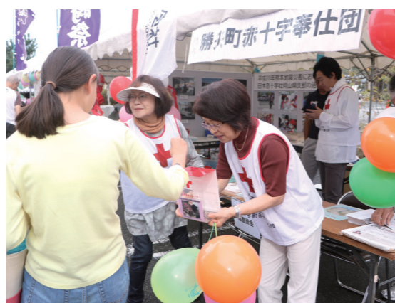
▲ 地域イベントでの赤十字ブースの出展