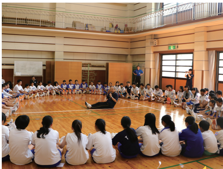
▲ 児童・生徒を対象としたレクリエーション指導