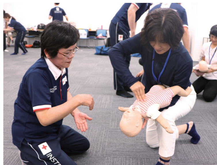
▲ 幼児安全法講習の指導