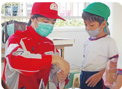
10月 幼稚園での防災セミナー (大分市 富士見が丘幼稚園)