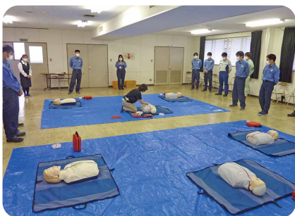
7月 救急法講習 (大分市 昭和電工㈱)

新型コロナウイルス感染拡大によって事業を停止した期間もありましたが、昨年7月より事業を再開しています。セミナー開催時には、時間や参加人数等の制約に気を配りながら、また、参加者の健康チェックを行う等、感染対策を万全にしています。