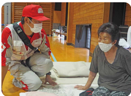
人吉市内の避難所にて 健康調査を行う救護班員