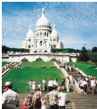
サクレ・クール寺院（フランス）