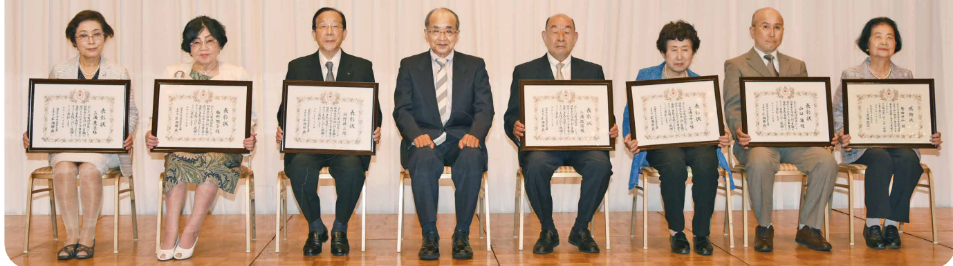
令和2年7月30日(木) 有功会総会にて会員へ支部長表彰状及び会長感謝状が贈られました