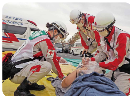
11月 国民保護共同実動訓練 (中津市 九州ダイハツアリーナ)