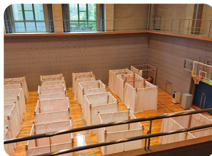
避難所には感染対策として 仕切りが設置されていた