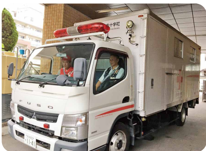
県内の被災地へ救援物資を輸送

日赤熊本県支部からの要請を受け、発災直後の7月5日に救護班第1班を派遣し、人吉市内の避難所を巡回しました。その後、熊本県支部の業務を支援する支援要員や、救護班第2班を続けて派遣し、甚大な被害に遭った熊本県に対して、継続的な支援を行いました。