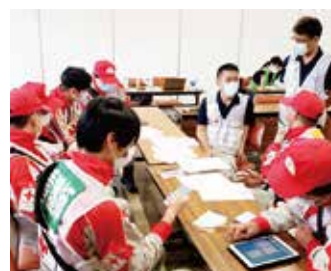
活動の間には入念な打ち合わせを行う

日赤熊本県支部からの要請を受け、発災直後の7月5日に医師や看護師等で編成される救護班を派遣しました。救護班は人吉市内の避難所を巡回し、被災者がどのような支援を必要としているか調査したほか、最大の避難所である人吉スポーツパレスに立ち上げた救護所の運営にあたりました。その後、熊本県支部の業務を支援する支援要員や、救護班第2班を続けて派遣。甚大な被害に遭った熊本県に対して、継続的な支援を行いました。