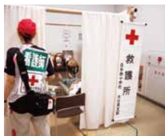
700人以上が過ごす避難所で救護所を運営