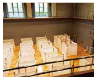
避難所では十分なスペースをとり仕切りが設置されていた