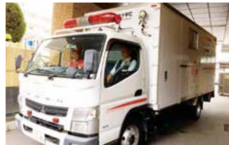
ボランティアの協力も得ながらトラックで物資を輸送

（※2）携帯ラジオ、懐中電灯、歯ブラシ、物干しロープなど、避難所生活に必要な20品目以上の物品がバッグに入っています。