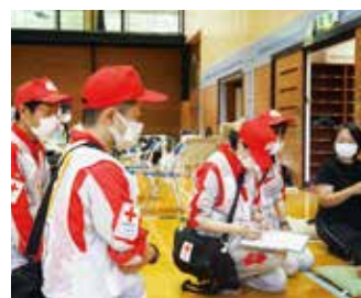
コロナ禍で初の災害救護感染対策に細心の注意を払う