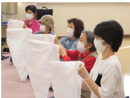
⑨災害時に役立つ応急手当