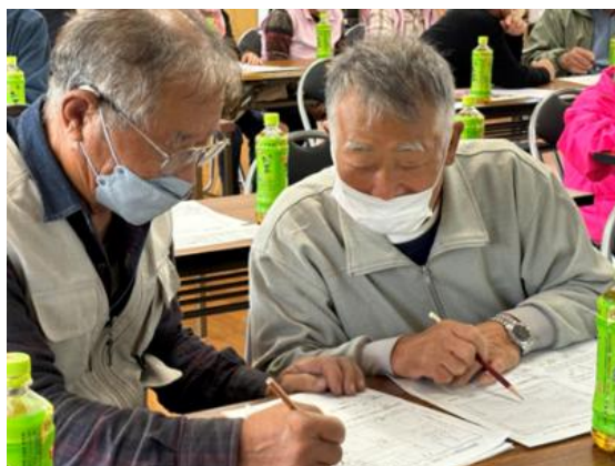
⑤家具安全対策ゲーム(KAG)