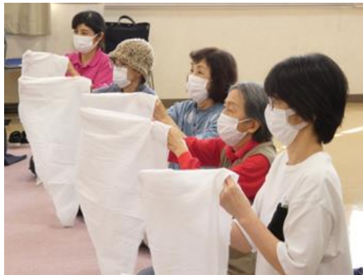
⑧災害時に役立つ応急手当等