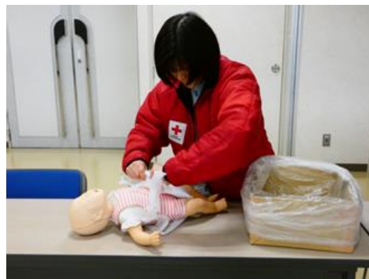
⑫乳幼児と保護者の避難生活と支援