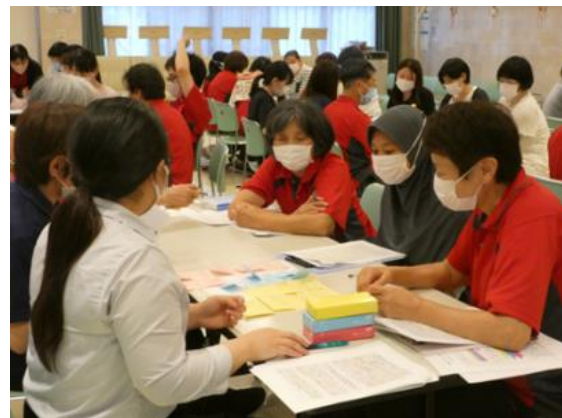
④災害エスノグラフィー