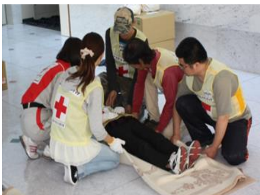
⑨毛布を使った搬送