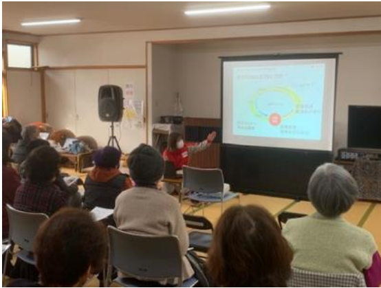
①日本赤十字社の紹介