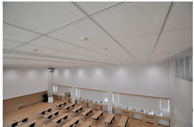
ちかくでみた あんぜんてんじょう