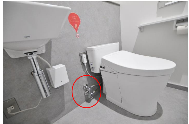
トイレのすいどうと、いどみずの2つのはいかん