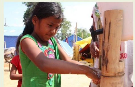
赤十字が設置した設備で手洗い

一人一人が感染を防ぐための衛生行動がひろく呼びかけられています。赤十字では平時より途上国において、水と衛生に関する活動を推進し、手洗い習慣の大切さを啓発しています。