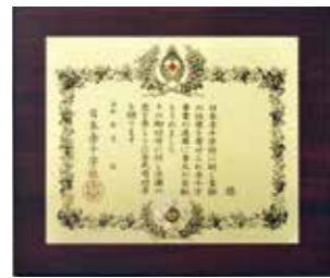
金色有功章 一時または累積で50万円以上 のご協力