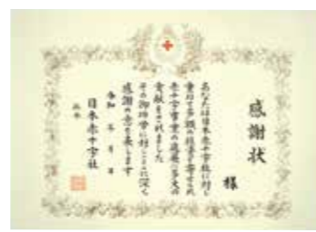
社長感謝状 金色有功章受章後、一時または累積 で50万円以上のご協力