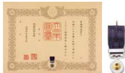
紺綬褒章 一時または分納の申し出により個人 500万円以上、法人等1,000万円以 上のご協力