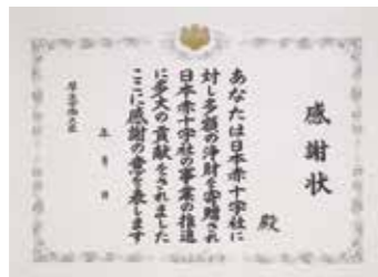
厚生労働大臣感謝状 同一年度内に一時または累計額が個人 100万円以上500万円未満、法人等 300万円以上1,000万円未満のご協力