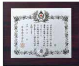
銀色有功章 一時または累積で20万円以上 50万円未満のご協力