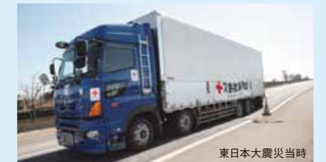
東日本大震災当時

掲載した支援プログラム以外でも、 貴社のノウハウやサービスを活かして 災害時の赤十字活動を支援していただけませんか？ 「当社のこの事業を災害時に役立ててほしい」 「地元の企業としてこんなことなら出来るかもしれない」など 様々なかたちでのご協力をお願いいたします。