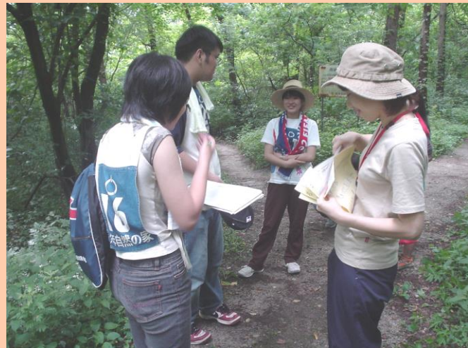
ウォークラリー ↑ みんなで協力しながら進みます

この理念に賛同し、赤十字の基本的な考え方を理解し、これを自校の教育活動に取り入れることを承諾した学校が「青少年赤十字加盟校」です