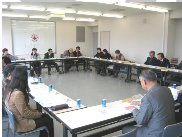
↑ 2/13 佐渡での会議風景 (旧佐和田町 アミューズメント佐渡にて)

これから新潟県も市町村合併が進むなか、奉仕団もお互いにより連携し、協力しあって活動できるようがんばっていきましょう