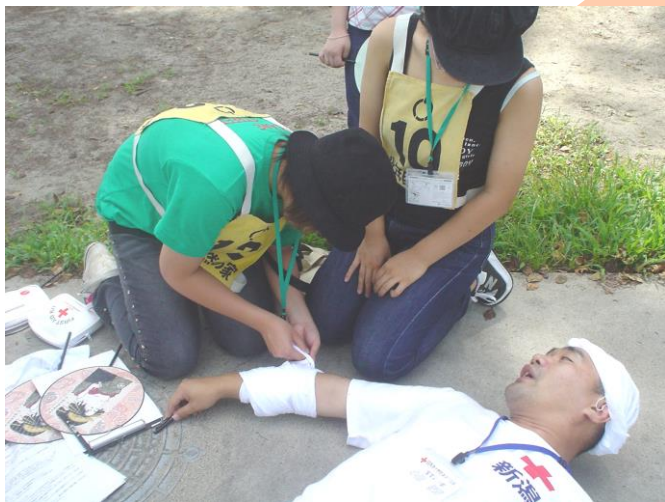
←はじめての 救急法