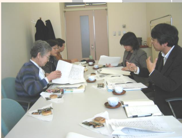
↑ 五泉市福祉会館で取材は行われました

なお赤十字奉仕団活動事例集は3月末に完成し、4月にはすべての奉仕団に配布される予定です。