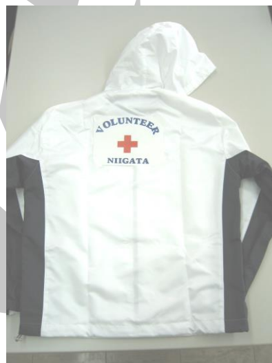
↑ はたして皆さん気に入って いただけたでしょうか？