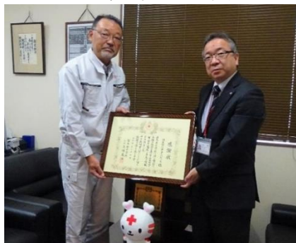
令和3年度新たにご入会いただいた株式会社テクノジェット様 (写真左)