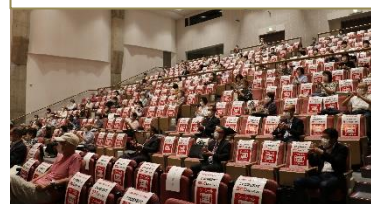
令和3年度終活セミナー

正式なご案内は、後日お送りいたします。今年度も、新型コロナウイルス感染症感染防止対策を講じての開催となるため、ご入場いただける人数に制限はございますが、ぜひお越しください。