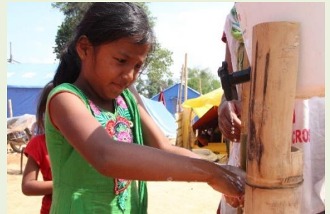
赤十字が設置した設備で手洗い

～非常時に役立つ平時の赤十字活動～ 一人一人が感染を防ぐための衛生行動がひろく呼びかけられています。途上国において、平時から水と衛生に関する活動を推進し、手洗い習慣の大切さを啓発しています。