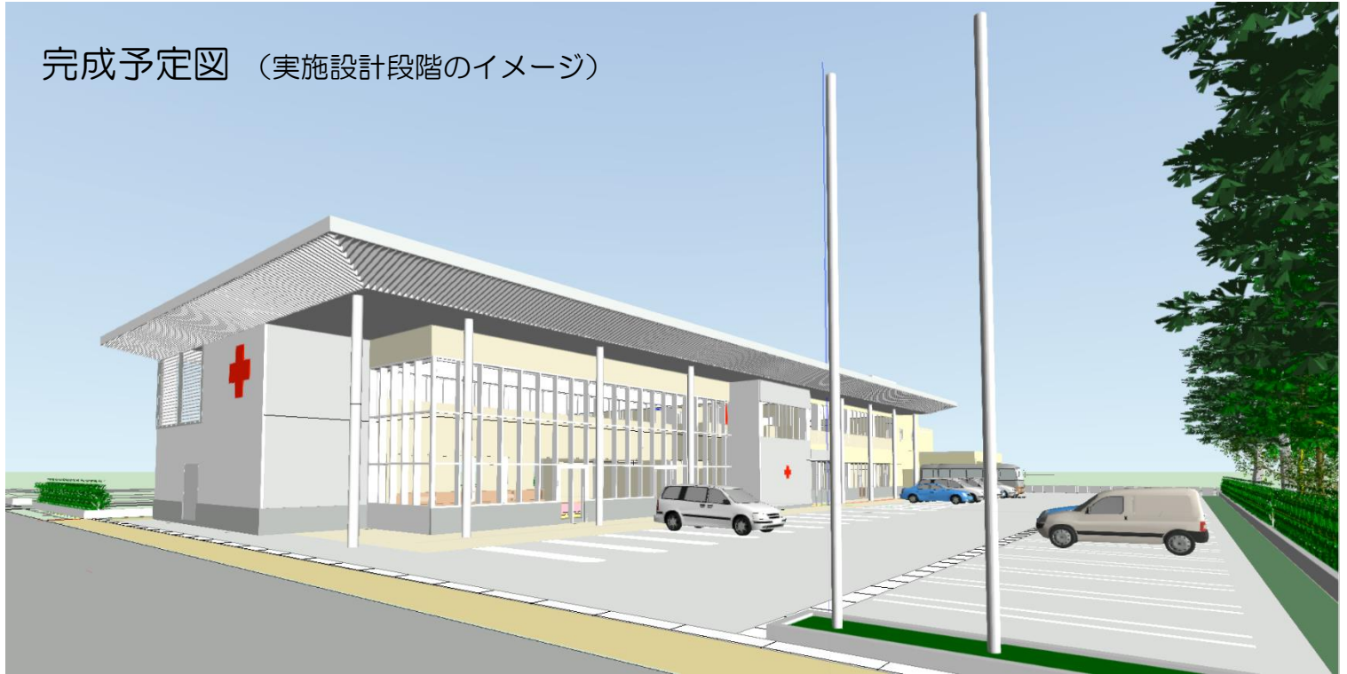
完成予定図 (実施設計段階のイメージ)