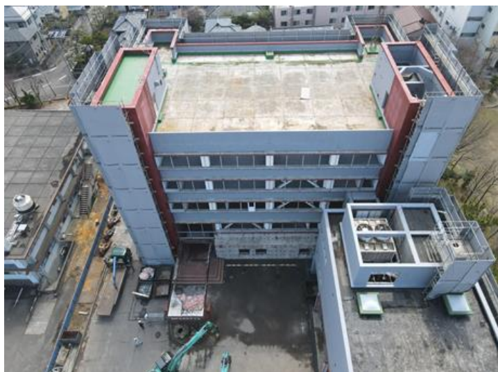
2022年4月5日 建物解体 着手