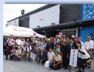
▲県有功会日帰り研修