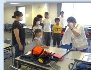
▲親子で学ぶぼうさい教室

いざ災害が起きてもあわてずに対応できるよう、おうちの危険な場所の確認や、身近にあるラップやビニール袋を使った応急手当などを学ぶぼうさい教室を開催しました。夏休み・冬休みの 2 回開催し、21 人の親子に参加いただきました。