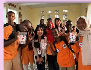
▲ジブチ共和国へ職員を派遣

また、日本赤十字社気候変動対応事業の現地調査として、ジブチ共和国へ職員を派遣しました。支部初の国際活動による海外派遣となりました。