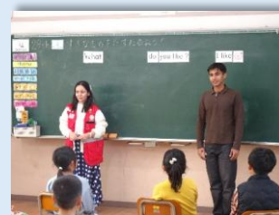
▲青少年赤十字国際交流事業

パキスタン青少年赤新月メンバー 2 人をお迎えし、5 日間の交流を通してお互いの文化や歴史を学び、青少年赤十字の実践目標の一つである「国際理解・親善」を深めることができました。