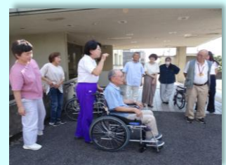
▲健康生活支援講習