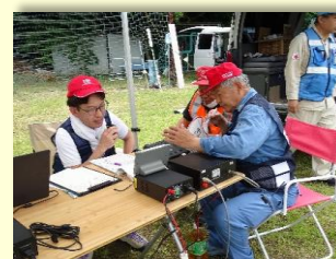
▲無線・救護奉仕団 ~救護訓練での無線通信~