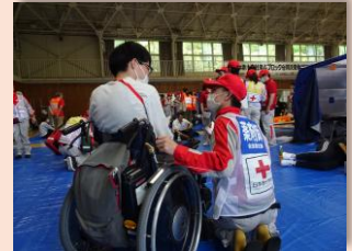
▲避難所アセスメント

国内で発生した災害に対して義援金の受付をおこない、被災者へお届けしました。 皆様からの温かいご支援に感謝申し上げます。