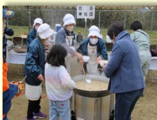
▲地域奉仕団 ~防災訓練での炊き出し~

奈良県支部では、団員の知識、技術向上のための研修や、活動の一助となる助成金を交付し、活動を支援しました。