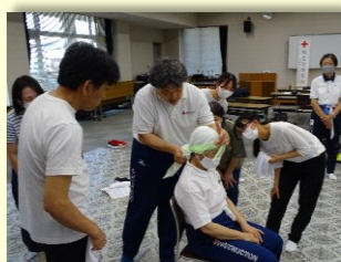
▲安全法指導奉仕団 ~講習会での指導~