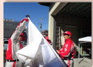
▲救護資機材習熟研修