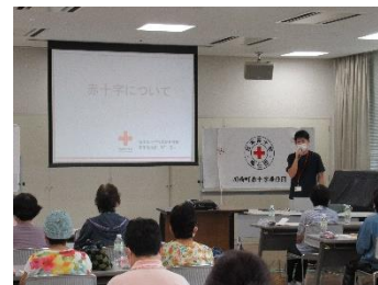
▲川西町赤十字奉仕団 講義「赤十字について」