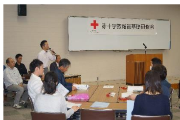
▲救護班基礎研修：支部主催