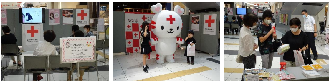
▲「赤十字フェスタ 2020 in なら」～イオンモール大和郡山～