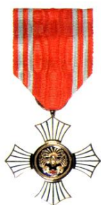
▲金色有功章:個人(左:男性 右:女性)