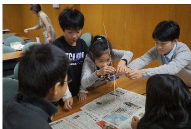
▲児童・生徒交流会での竹ひごタワー作成