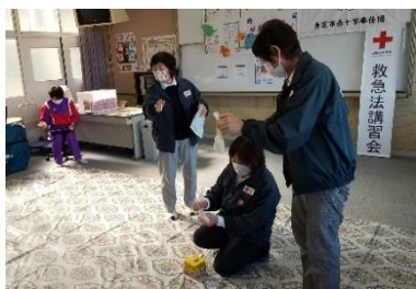
▲香芝市赤十字奉仕団による救急法講習会、防災啓発の実施