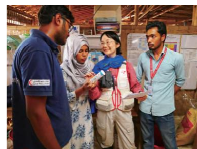
▲地元看護師に医薬品について説明する 日赤看護師(バングラデシュ)