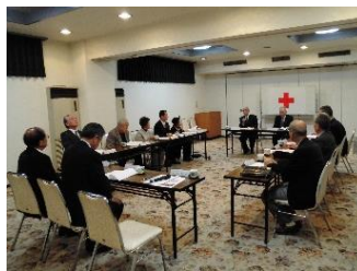
▲有功会連絡協議会