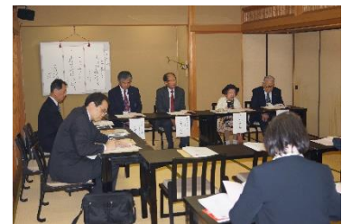
▲地区有功会総会(大和郡山市)