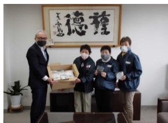
▲御所市赤十字奉仕団 ～独居老人に向けた手作りマスクの配布～