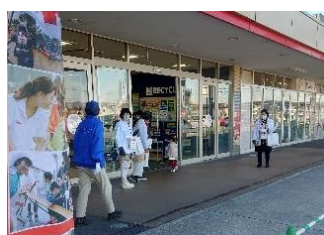
▲広陵町赤十字奉仕団 ～イズミヤスーパーセンター広陵店～