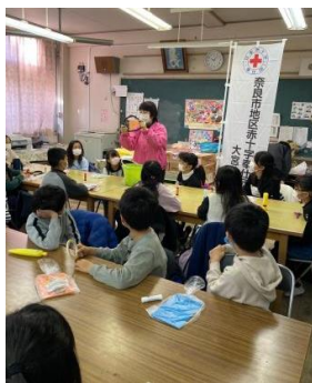
▲奈良市地区赤十字奉仕団大宮分団 ～大宮ふれあい農園～