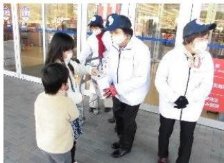
▲御所市赤十字奉仕団 ～スーパーセンターオークワ御所店～