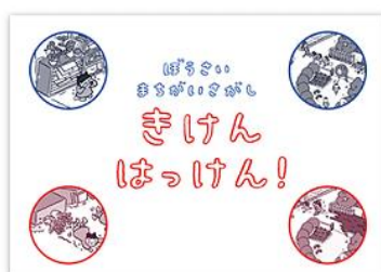
▲幼稚園、保育園向け防災教育教材 「ぼうさいまちがいさがし きけんはっけん!」