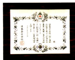
▲金色有功章(法人) 銀色有功章(個人・法人)