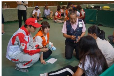
▲避難所アセスメント