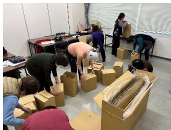
▲宇陀市赤十字奉仕団 段ボールベッド作成

地域奉仕団の基礎、災害時の役割や避難所で役立つ知識を習得することを目的に、地域奉仕団の役割、避難所での生活支援、避難所グッズの作製などに取り組みます。