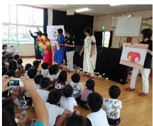
▲香芝市赤十字奉仕団 ～寸げき、紙芝居～