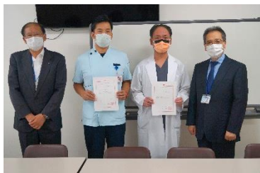
▲日赤災害医療コーディネーター及びコーディネートスタッフを委嘱

また、本社主催の研修（全国救護班研修、日赤災害医療コーディネート研修など）にも積極的に参加していただきます。