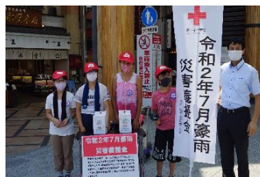
▲「令和2年7月豪雨災害義援金」街頭募金のようす