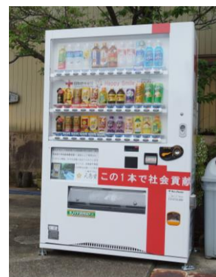
▲寄付金付自動販売機