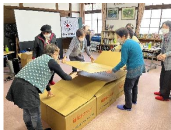
▲山添村赤十字奉仕団 段ボールベッド作成