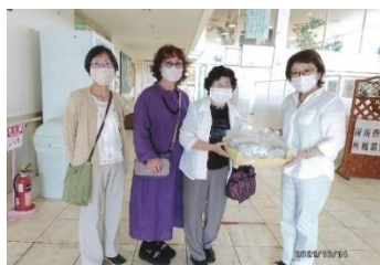
▲奈良市地区赤十字奉仕団左京分団 ～手作りマスク普及活動～