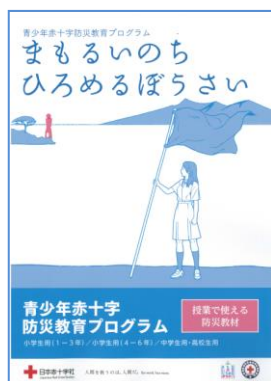
▲防災教育プログラム 「まもるいのち ひろめるぼうさい」