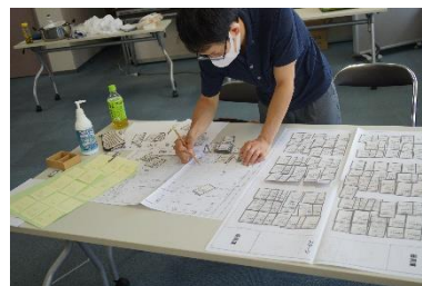
▲避難所運営ゲーム HUG