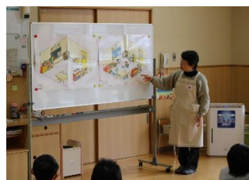
▲五條市赤十字奉仕団 ～ぼうさいまちがいさがしけんはっけん～