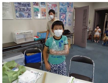
▲身近なものを使った応急手当