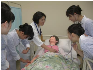
▲実技演習の授業風景

(平成 22 年度まで和歌山、平成 23 年度から令和 2 年度まで大阪、令和 3 年度から京都第二)