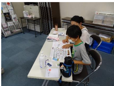
▲災害を想定したシミュレーション

奈良県青少年赤十字指導者協議会と協働して、非常食作り体験、ラップやビニール袋など身近なものを使った手当、毛布ガウンやホットタオルなど非常時に対応できる知識について学びます。