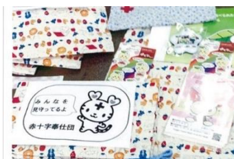
▲大淀町赤十字奉仕団 ～園児へ布袋など贈呈～