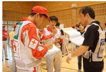
▲避難所アセスメント