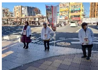
▲奈良市地区赤十字奉仕団 ～近鉄奈良駅前～