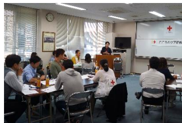
▲こころのケア研修：支部主催