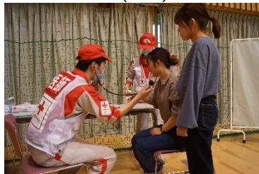
▲救護所での医療救護活動