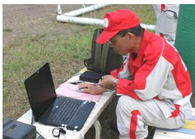
▲災害救護訓練での通信訓練