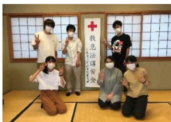
▲救急法短期講習会