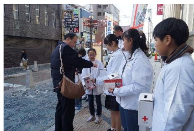
▲NHK 海外たすけあい街頭募金のようす