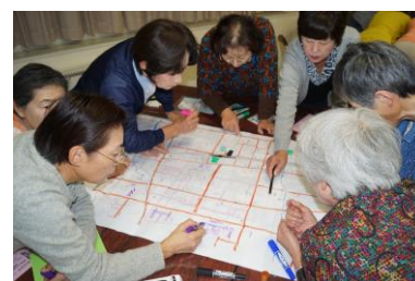
▲赤十字防災セミナー

自らの居住地域で、防災上の資源や災害時に出現する危険性を地図に明記し、個人や地域単位であらかじめ行うべき取り組みについて検討し理解を深めます。