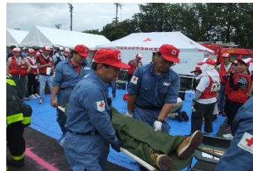
▲防災ボランティアによる担架搬送