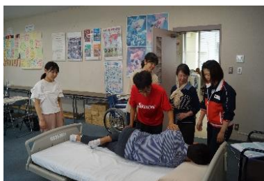
▲健康生活支援講習