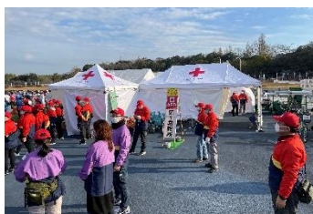
▲奈良マラソンでの救護活動