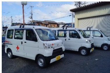
▲災害救援車(地区分区配備)