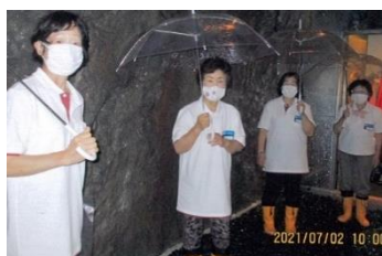
▲大淀町赤十字奉仕団 ～大滝ダム学べる防災ステーション～