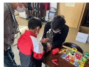
▲パパおススメ子どもとアウトドア (奈良市平城分団の活動に協力)