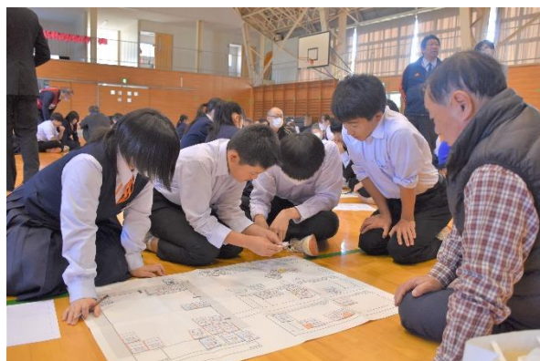
学生と地域住民が一体に 赤十字防災セミナー

グループは学生と地域住民の混合で編成され、生徒と住民が一体となって防災意識を高めることができました。地域の代表者は、「いつ起こるか分からない大規模災害に備える大切さが分かった」と感想を語りました。