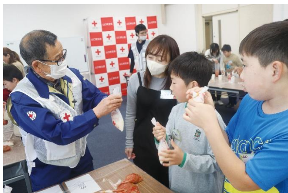
子どもと一緒に楽しく防災！ 親子防災教室開催