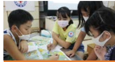
未来を担う子どもたちに思いやりの心を

県内204校の加盟校では、長野県教育委員会と連携し、人権や防災などの赤十字プログラムを取り入れ、子どもたちの「気づき・考え・実行する」力を育成しています。