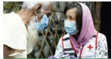
国際赤十字のネットワークを活かして

世界各地で紛争、災害、病気といった人道危機に苦しむ人々への支援を届けるため、192の国と地域に広がる赤十字のネットワークを活かして支援活動に取り組んでいます。