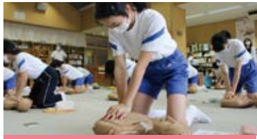
とっさの手当てがいのちを救う

県内各地で救急法・水上安全法・健康生活支援講習・幼児安全法の講習会を開催し、応急手当の方法や事故防止の思想、また健やかな生活を送るために役立つ知識と技術を普及しています。