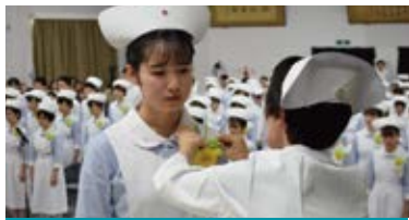
人の痛みに優しく寄り添う看護を目指して

赤十字理念に基づいた教育を通じ、豊かな人間性を育み、看護に関する幅広い能力を備えた救護看護師を養成しています。