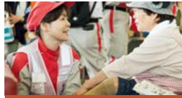
万が一の災害に備えて

地震や豪雨などの災害が発生した場合、医療救護班の派遣・救護物資の配布等さまざまな支援活動を行います。また、訓練・研修の実施、防災・減災意識の啓発にも努めています。