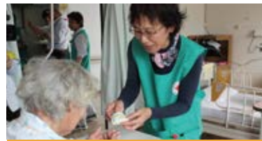
赤十字活動を支える大きな力

県内各市町村に組織される地域奉仕団、おおむね18～30歳の社会人や学生が所属する青年奉仕団、専門知識・技術を持つ特殊奉仕団が、各地でさまざまなボランティア活動に取り組んでいます。