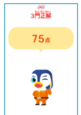
設問の回答を採点し 習熟度を確認