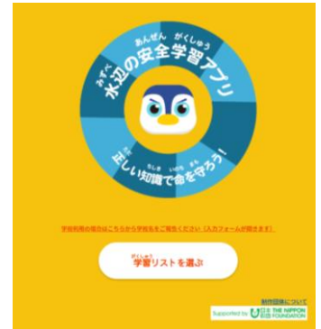
学習アプリトップ画面

※日本赤十字社、一般社団法人水難学会、公益財団法人河川財団、公益社団法人日本水難救済会、NPO法人川に学ぶ体験活動協議会、公益財団法人ブルーシー・アンド・グリーンランド財団