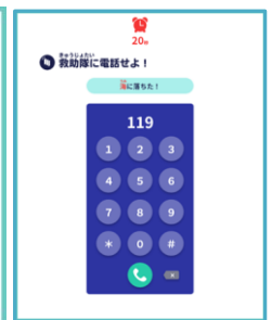
緊急時の通報内容を確認