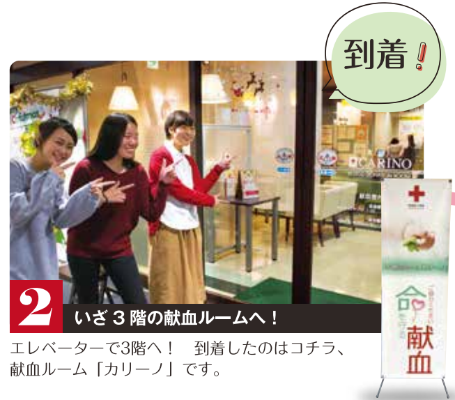
2 いざ3階の献血ルームへ！ 到着！

今日は、JR宮崎駅より徒歩7分、カリーノ宮崎へやってきました。でも今日はショッピングに来たんじゃありません！