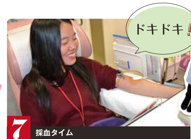
7 採血タイム ドキドキ！

問診後は献血いただく方の健康を守るためヘモグロビン濃度が採血基準を満たしているかの測定と血液型の事前検査を行います。