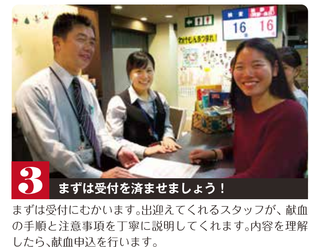
3 まずは受付を済ませましょう！

まずは受付にむかいます。出迎えてくれるスタッフが、献血の手順と注意事項を丁寧に説明してくれます。内容を理解したら、献血申込を行います。