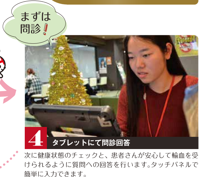
4 タブレットにて問診回答 まずは問診！

まずは受付にむかいます。出迎えてくれるスタッフが、献血の手順と注意事項を丁寧に説明してくれます。内容を理解したら、献血申込を行います。