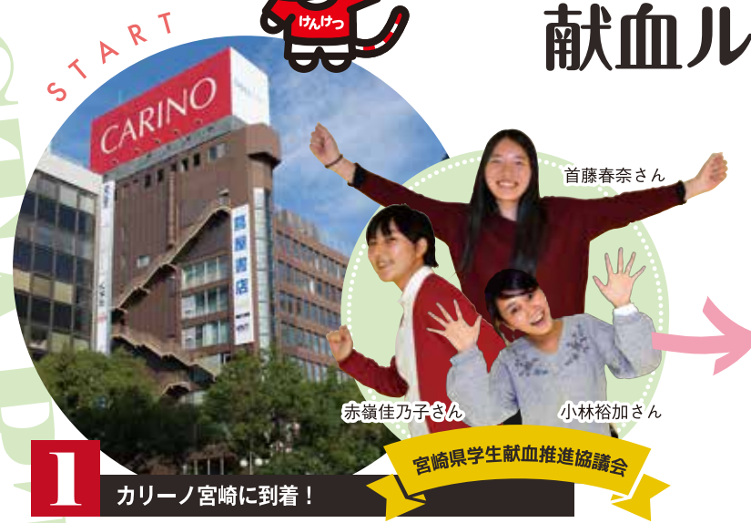
1 カリーノ宮崎に到着！ 宮崎県学生献血推進協議会

今日は、JR宮崎駅より徒歩7分、カリーノ宮崎へやってきました。でも今日はショッピングに来たんじゃありません！