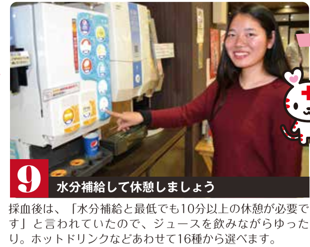
9 水分補給して休憩しましょう

採血中はTVを観たり、読書をしながらゆったりと過ごせるのであっという間に時間が過ぎていきます。全血献血で実際に針を刺している時間は10~15分ほどなんです。