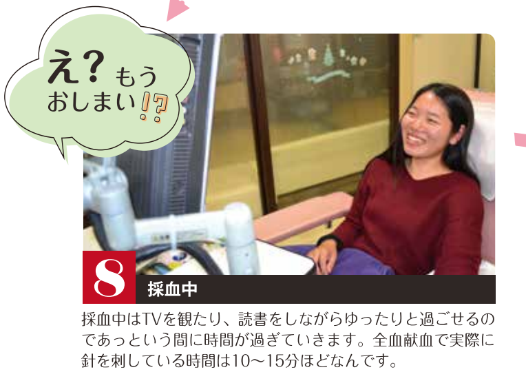
8 採血中 え？もうおしまい!?

採血中はTVを観たり、読書をしながらゆったりと過ごせるのであっという間に時間が過ぎていきます。全血献血で実際に針を刺している時間は10~15分ほどなんです。