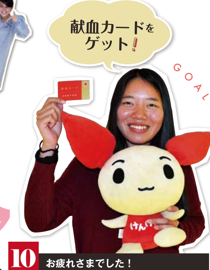
10 お疲れさまでした！ GOAL

採血後は、「水分補給と最低でも10分以上の休憩が必要です」と言われていたので、ジュースを飲みながらゆったり。ホットドリンクなどあわせて16種から選べます。