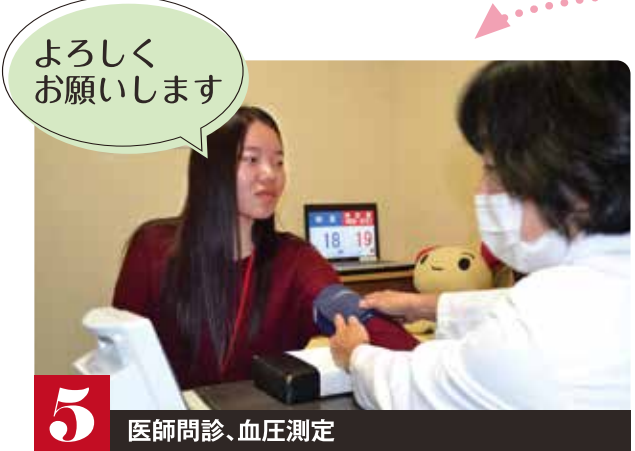
5 医師問診、血圧測定 よろしくお祈りします

次に健康状態のチェックと、患者さんが安心して輸血を受けられるように質問への回答を行います。タッチパネルで簡単に入力できます。