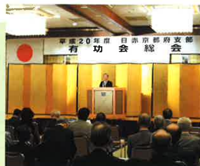
（写真）平成20年10月10日開催の有功会総会

京都府支部有功会は、災害救護活動や復興支援活動、また、血液事業や看護師の養成など赤十字の行う人道的な諸事業に賛同し、金色有功章（50万円以上の寄付者に対する表彰）を日本赤十字社から贈られた方々が、赤十字活動を支援していこうと、昭和37年に、全国で3番目の有功会として結成された団体です。現在、会員は約500名です。