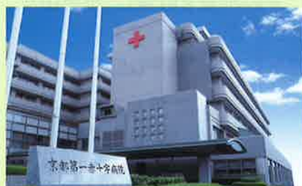
京都第一赤十字病院