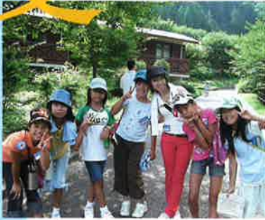
このトレーニング・センターは、青少年赤十字加盟校メンバーのリーダー養成を目的に毎年開催しています。