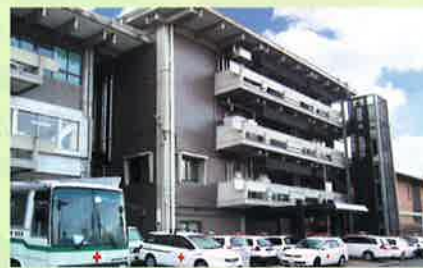
京都府赤十字血液センター