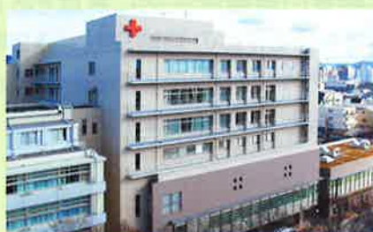
京都第二赤十字病院