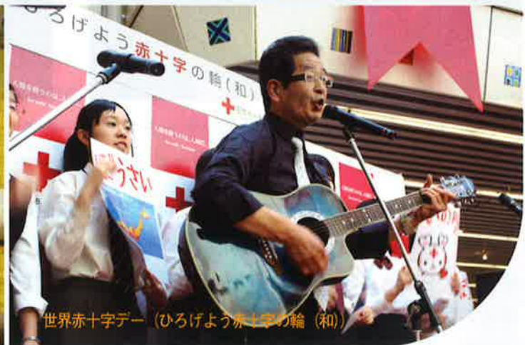
世界赤十字デー (ひろげよう赤十字の輪(和))