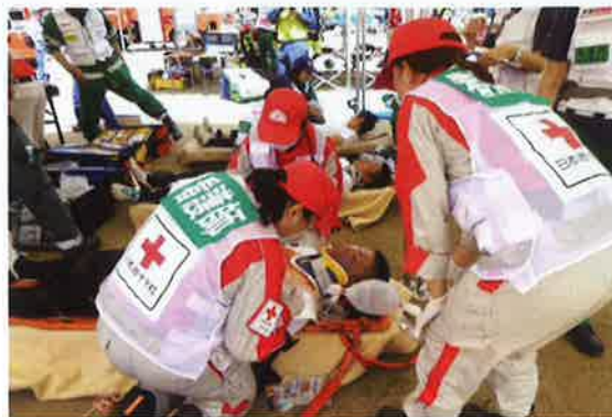
京都府総合防災訓練（南丹市）

9月の防災週間に各自治体の主催する防災訓練に参加し、実践に即した内容の訓練を展開しました。また、8月11日には京都府支部管内施設の救護班要員が一堂に会した研修会を開催し、非常時の対応能力の維持・向上に向けて取り組みました。