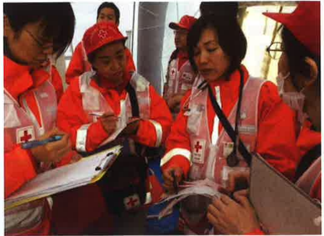
各避難所に関する情報交換

平成 28 年 4 月 14 日及び 16 日に、観測史上初めて震度 7 の地震が連続した熊本地震が発生しました。京都府支部では、本震発災直後の 16 日早朝から DMAT（災害派遣医療チーム）3 班を、その後、医師、看護師等からなる救護班 6 班、その他災害医療コーディネーター班など計 76 名の職員を熊本に派遣し、熊本市内、益城町、南阿蘇村などにおいて各避難所の巡回診療や救護所の運営、熊本赤十字病院の支援業務や被災された方のこころのケアなどの救護活動を行いました。