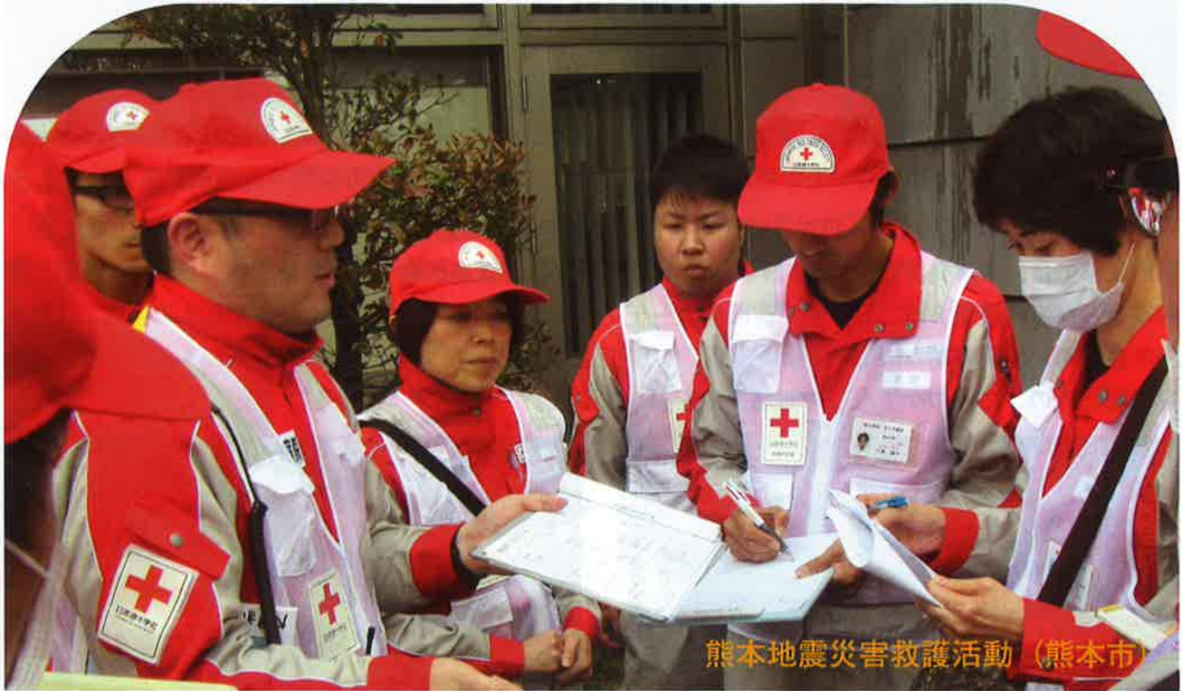
熊本地震災害救護活動 (熊本市)

〒605-0941 京都市東山区三十三間堂廻り町644 TEL 075-541-9326 FAX 075-541-1361