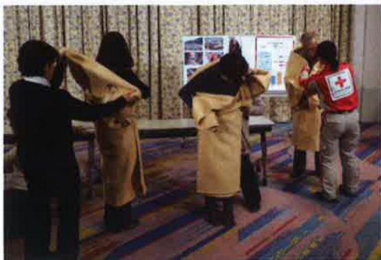
赤十字地域防災セミナー（毛布でガウンを作成）

京都府支部では、日常生活において健康で安全な生活が送れるように、救急法、水上安全法、健康生活支援講習、幼児安全法等の講習を行っているほか、災害に備える方法を学ぶ、赤十字地域防災セミナーを企画・実施しています。