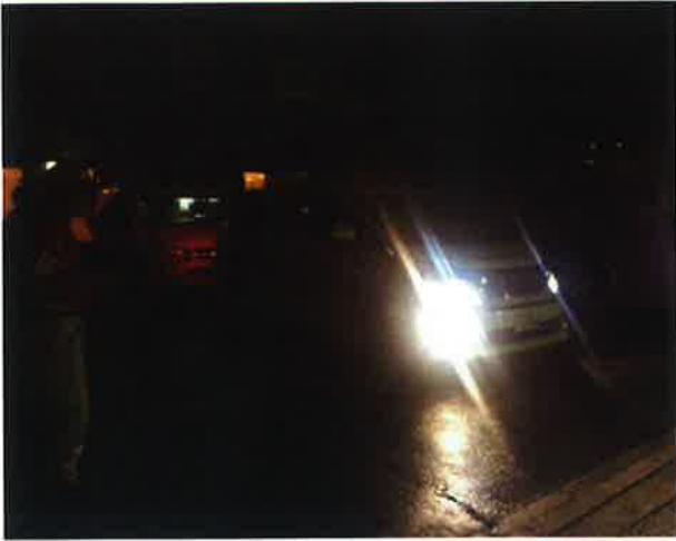
4月16日早朝にDMATが出動