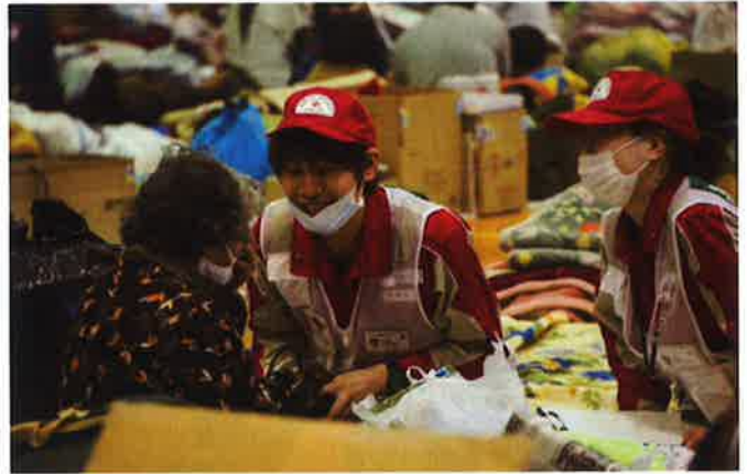
避難所での高齢者への声かけ