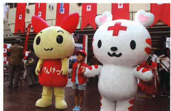
けんけつちゃんとハートラちゃんが登場!