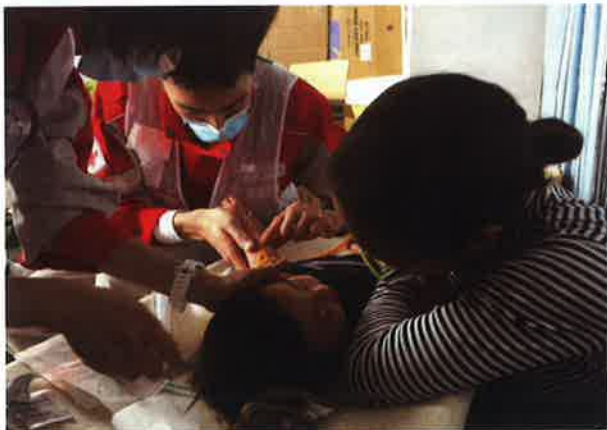
救護所での医療活動

平成 28 年 4 月 14 日及び 16 日に、観測史上初めて震度 7 の地震が連続した熊本地震が発生しました。京都府支部では、本震発災直後の 16 日早朝から DMAT（災害派遣医療チーム）3 班を、その後、医師、看護師等からなる救護班 6 班、その他災害医療コーディネーター班など計 76 名の職員を熊本に派遣し、熊本市内、益城町、南阿蘇村などにおいて各避難所の巡回診療や救護所の運営、熊本赤十字病院の支援業務や被災された方のこころのケアなどの救護活動を行いました。