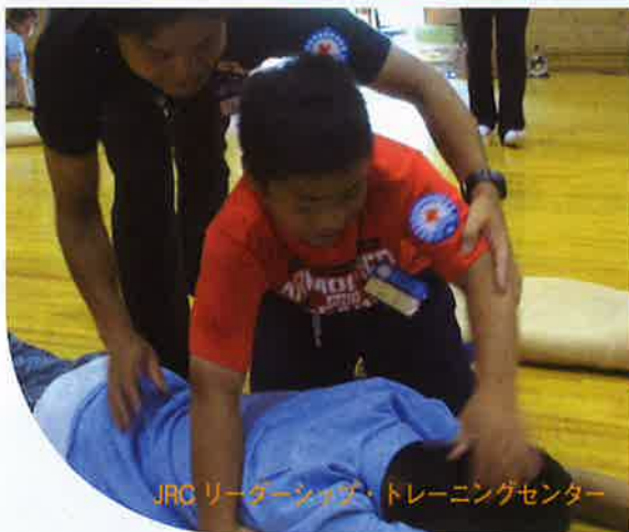
JRC リーダーシップ・トレーニングセンター