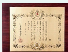
金色有功章(法人・団体)