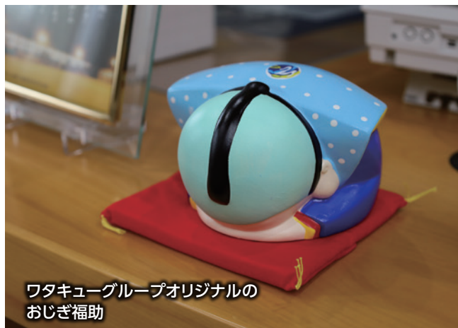
ワタキューグループオリジナルのおじぎ補助