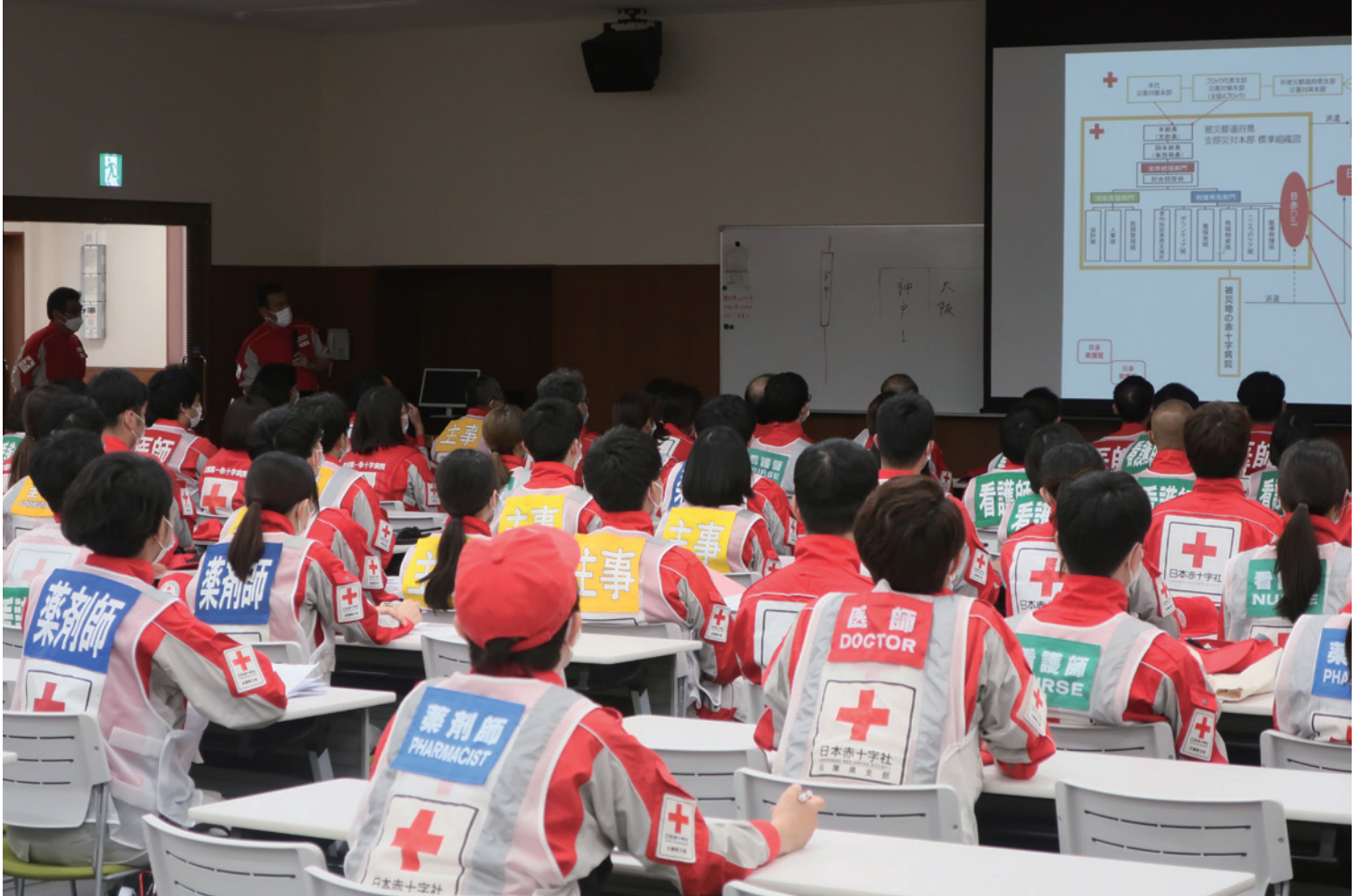
第27回 日本赤十字社第4ブロック合同災害救護訓練の様子