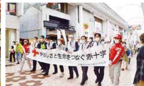
横断幕を掲げ赤十字をPRしました