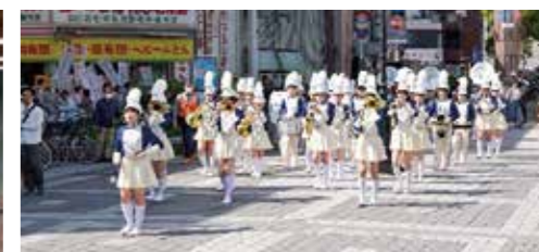
土佐女子中学・高等学校吹奏楽部