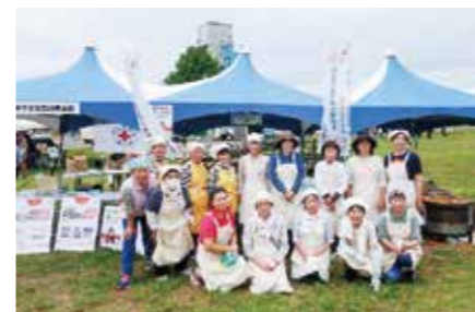
安芸地区赤十字奉仕団のみなさん