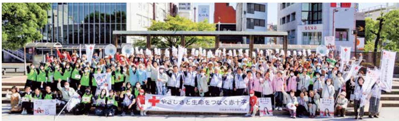
赤十字運動月間啓発パレード R5.4.22 (土) (3 頁記載)