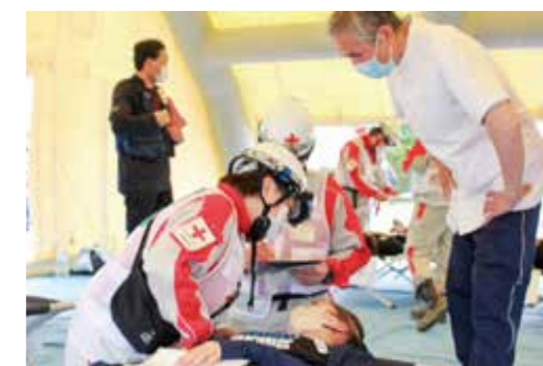
災害医療訓練の様子

また、地域防災フェスティバルでは、安芸地区の赤十字奉仕団にご協力いただき、炊飯袋（ハイゼックス）を使用したおにぎり400食を来場者へ配布。また、安全奉仕団による「身近なものを使用した応急手当」も体験いただきました。