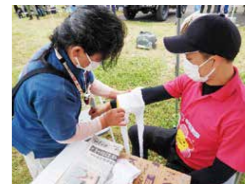
安全奉仕団による応急手当の体験コーナー