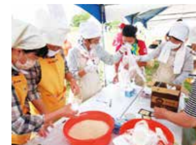
炊き出し訓練の様子