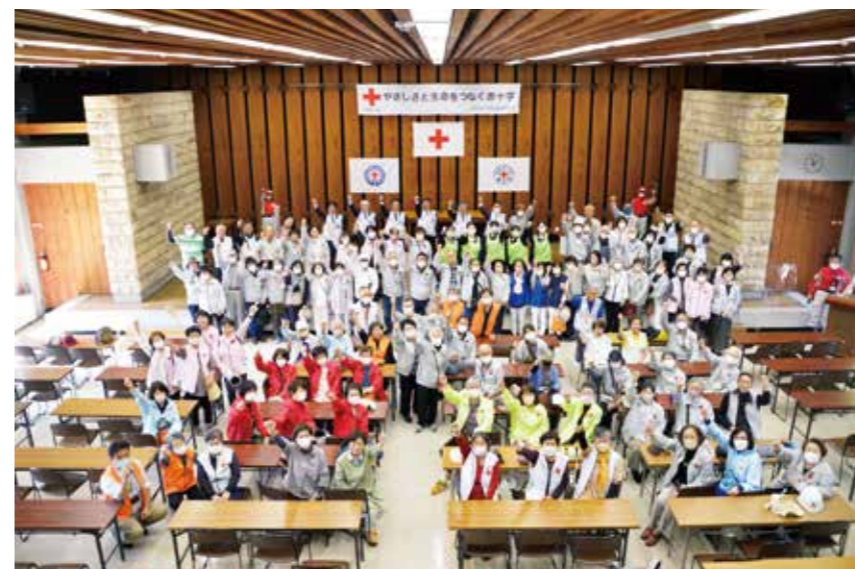
いざ出陣！（出発式 県庁正庁ホールにて）

4月22日（土）、5月の赤十字運動月間を啓発するためパレードを開催しました。土佐女子中学・高等学校吹奏楽部の楽しい演奏の中、5回目となる今年は天候にも恵まれ、各地域の奉仕団や地区区分の関係者の方々、赤十字施設職員等約230名が参加し、晴れやかな天候の下、ひろめ市場から高知市中央公園まで帯屋町アーケードを行進、青少年赤十字の生徒による募金活動も行い、県民の皆さまに赤十字をアピールしました。