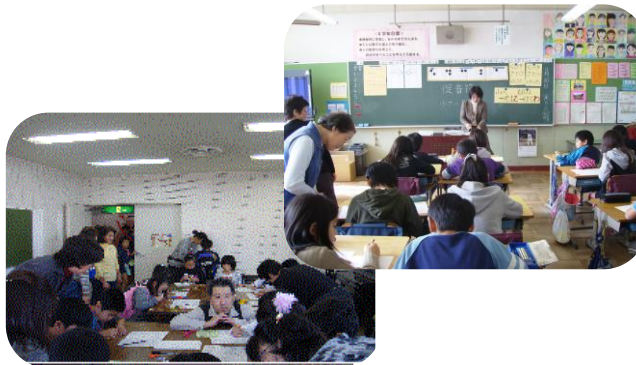
小学校、子供会の「点字体験」

自治会主催の点字教室で 子供たちと触れ合うと、 とても興味をもってくれて 嬉しくなります