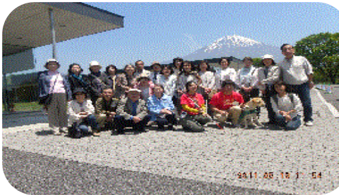
盲導犬センターを訪れた時