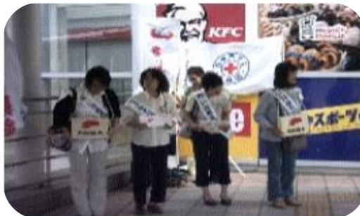
赤い羽根募金に参加して