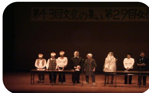
「文化の集い」で一緒に朗読劇